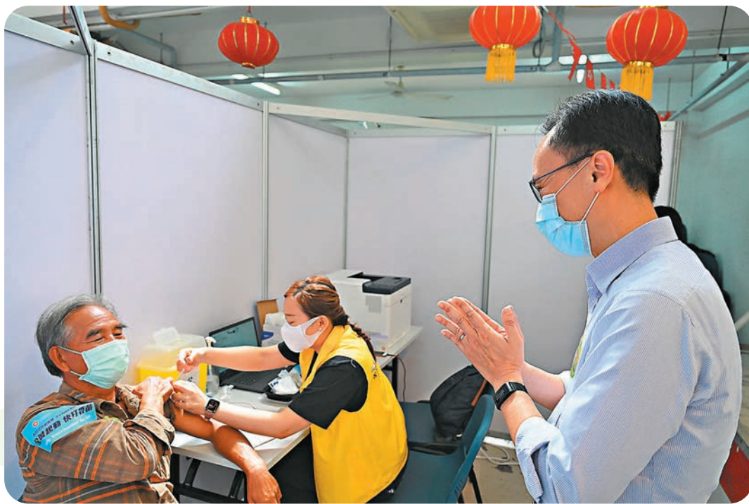
●聶德權(右)向參加健康講座後接種科興疫苗的長者表示謝意。

至於市民是否需要打第三針，他表示，第三針未必覆蓋所有市民，特區政府屆時會視乎覆蓋情況和數量，作適切的安排，而特區政府購買的科興及復必泰疫苗各有750萬劑，有足夠數量供市民打第三針。