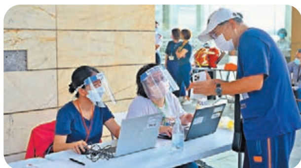
▲特區政府昨日上午完成圍封西灣河嘉亨灣第一座強檢，未發現新個案。

昨日新增的其餘5宗輸入病例，其中3人為外僱。一名34歲女僱已在菲律賓接種兩劑科興疫苗，本月12日搭乘宿霧太平洋航空5J272航班抵港，於竹篙灣檢疫中心確診；同樣來自菲國的另一名35歲女僱，在當地接種兩劑復必泰疫苗，於本月14日搭乘5J272航