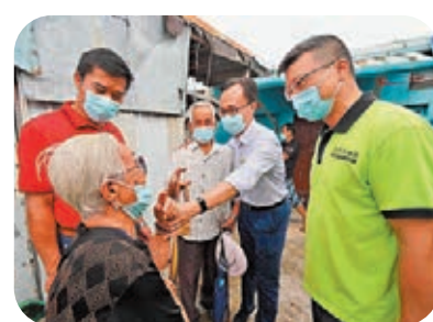
▲聶德權到訪大澳視察外展服務，並問候在場長者。