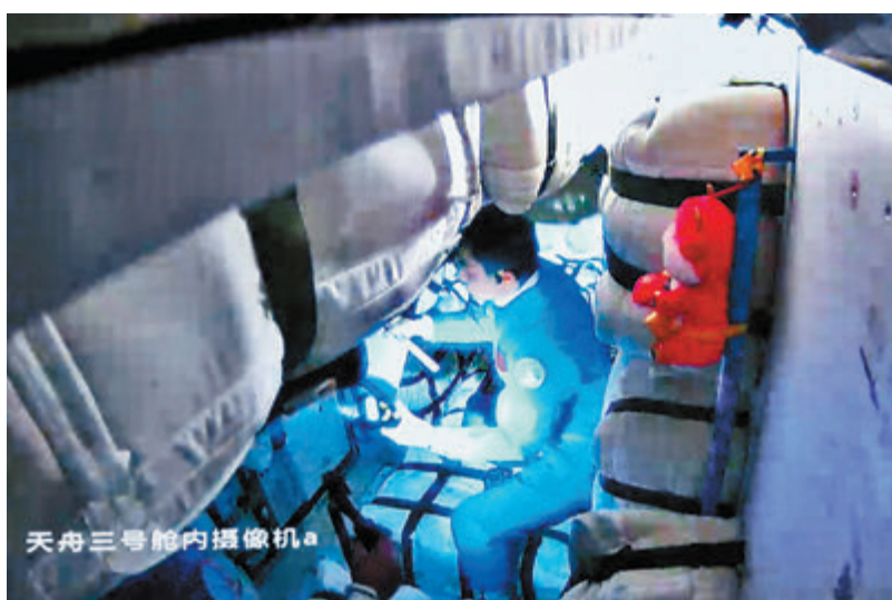
●10月17日9時50分,神十三乘組成功開啟貨物艙艙門,並順利進入天舟三號貨運飛船。

香港文匯報訊 據中新社報道,中國載人航天工程辦公室發布消息,在順利進駐中國空間站天和核心艙後,北京時間10月17日9時50分,神舟十三號航天员乘組成功開啟貨物艙艙門,並順利進入天舟三號貨運飛船。接下來,航天员乘組還將開啟天舟二號貨運飛船貨物艙艙門。後續,航天员乘組將按計劃開展貨物轉運等相關工作。