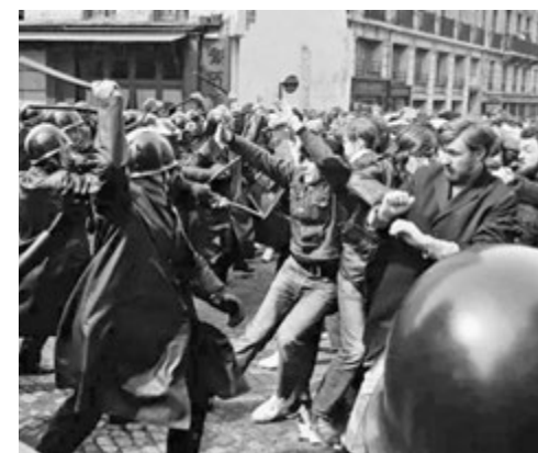
●巴黎警方當年血腥鎮壓阿爾及利亞人。

紀念儀式昨日在巴黎市郊塞納河畔當年舉行抗議的社區舉行，馬克龍在儀式上未有為當年巴黎警方的行為正式道歉，愛麗舍宮其後發表聲明，譴責鎮壓行動是「不可原諒的罪行」。阿爾及利亞總統特本同日發聲明，