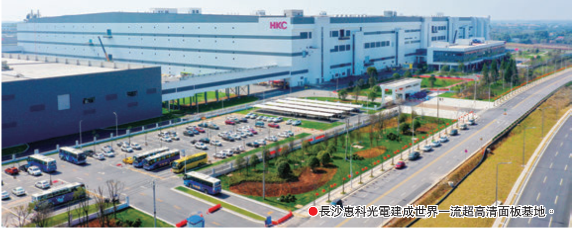
● 長沙惠科光電建成世界一流超高清面板基地。

一花引來萬花開。除了藍思科技、惠科光電等龍頭企業的人駐，還有歐智通、啟泰傳感、孝文科技、卓