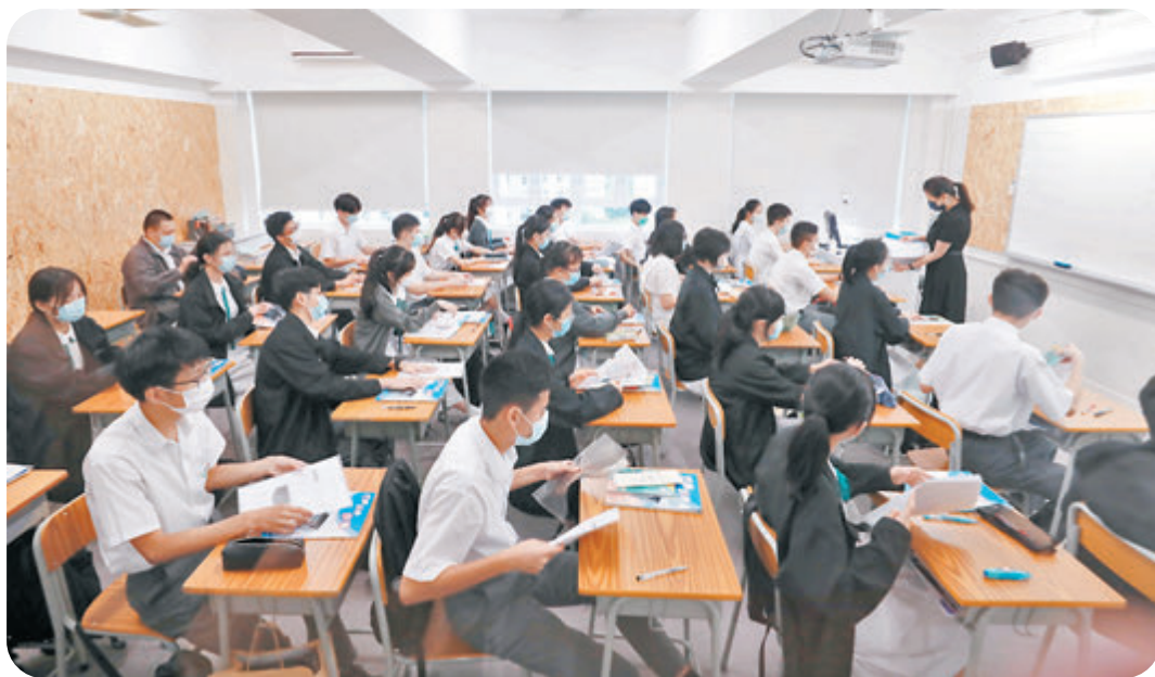
▶家長及學生希望全面恢復面授課堂。圖為協和地利亞中六級全日面授課。資料圖片