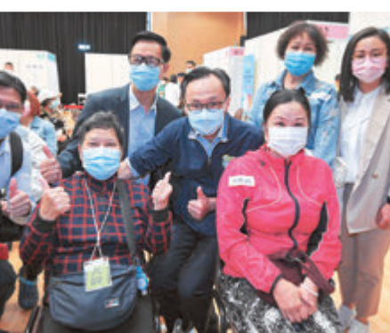
●聶德權(右四)與參加者和主辦單位代表合照。

特區政府公務員事務局局長聶德權昨日到屯門醫院接種站，了解過去兩個多星期以來的運作情況和經驗，聆聽接種疫苗的市民「用家」意見，以更好地推動接種新冠疫苗。他說，屯門醫院接種站