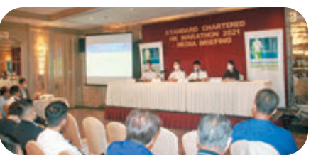
●警方與運輸署代表講解比賽當日的封路措施。

今次是香港國安法生效後的首個渣打香港馬拉松。被問到會否禁止某些服裝或標語時，高威林指不會限制任何服裝顏色及標語，但不可阻礙賽事進行，工作人員會在起點為跑手作適當檢查，惟