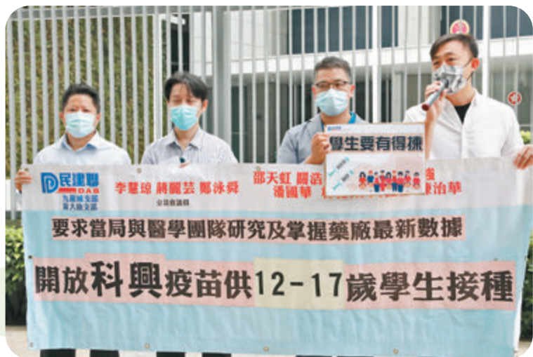
▲民建聯促特區政府從速開放科興予12歲至17歲學生接種。