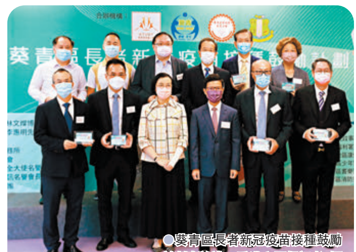
●葵青區長者新冠疫苗接种鼓勵計劃嘉許禮。

香港文匯報訊(記者 子京)為照顧長者健康，社會各界紛紛獻計鼓勵長者接種新冠疫苗。在社區熱心人士贊助125萬元的超市禮券下，葵青區各地區團體及人士早前推出「葵青區長者新冠疫苗接种鼓勵計劃」，吸引了超過4,500名60歲以上當區長者接種新冠疫苗。 該計劃日前舉辦嘉許禮，出席活動的食物及衛生局局長陳肇始表示，要預防新冠疫情，促進兩地早日恢復正常通關，須提高