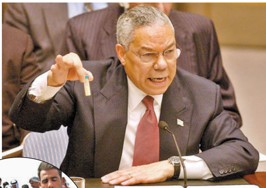
▲2003年出席聯合國大會時拿着一小瓶不明物質，聲稱伊拉克可能擁有大殺傷力武器，成為美國對伊拉克發動侵略戰爭(左圖)的理據。資料圖片