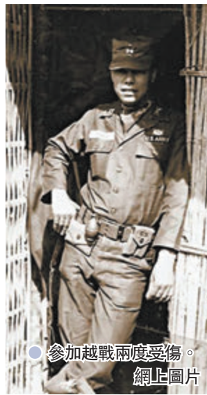
●參加越戰兩度受傷。