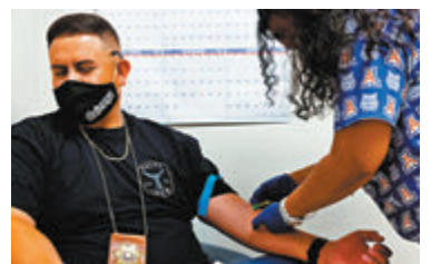
●美國民眾進行抗體測試。資料圖片

知長者和免疫系統有缺陷人士等高危人士，打針後是否產生抗體，並且在接種加強針後抗體水平是否有提高。