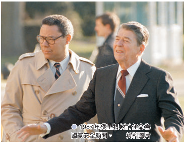
●1987年獲里根(右)任命為國家安全顧問。