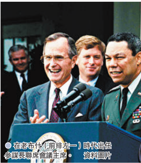
●在老布什(前排左一)時代出任參謀長聯席會議主席。資料圖片