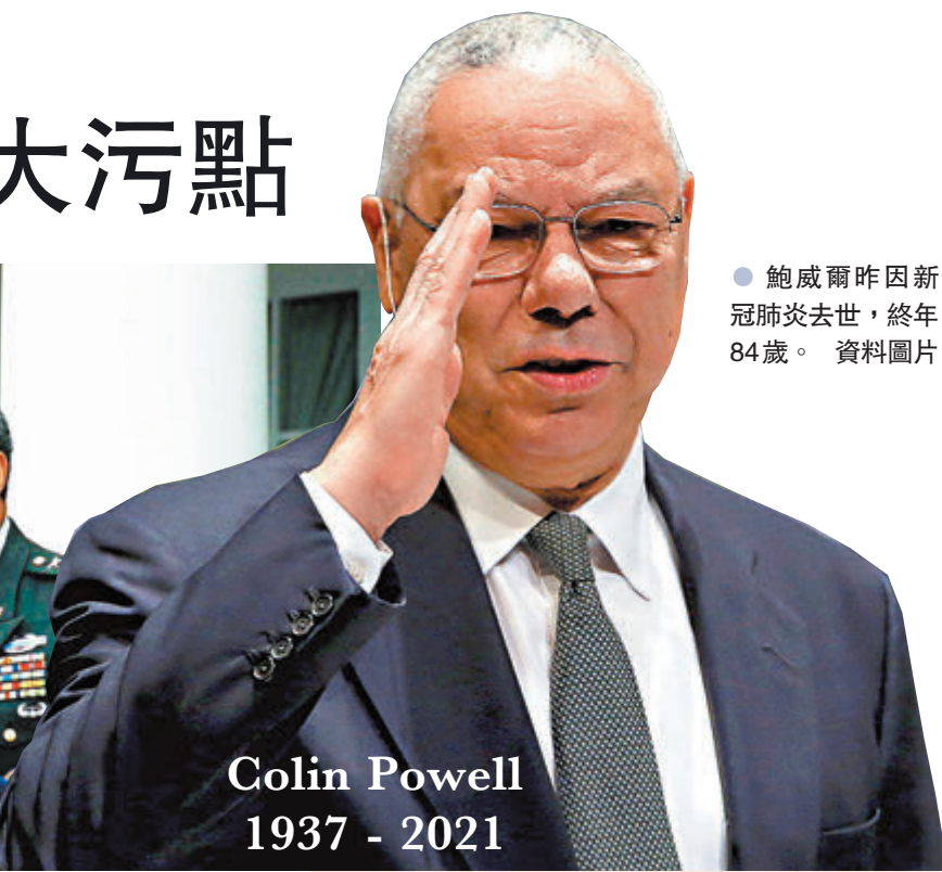
Colin Powell 1937 - 2021