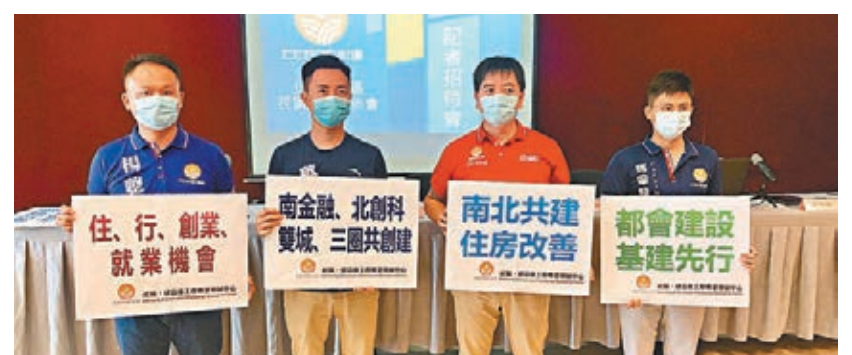
●「北部都會區關注組」公布問卷調查。

關注組認為，現時社會比較穩定，又得到各方支持，特區政府應加快「北部都會區」發展，相信未來5年至8年北部都會區已經會有不錯的發展。對於推行「北部都會區」或涉高昂成本，關注組提出可通過發債、共同承擔模式、公私營混合模式及民間營運後轉移模式等解決。他們並認為，特區政府應修訂《城市規劃條例》，加