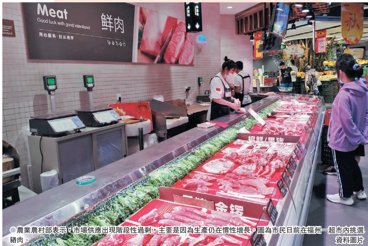
農業農村部表示，市場供應出現階段性過剩，主要是因為生產仍在慣性增長。圖為市民日前在福州一超市內挑選豬肉。

香港文匯報訊（記者 任芳韻 北京報道）中國農業農村部20日對外表示，9月份全國養豬場（戶）虧損面達到76.7%，生豬供應相對過剩局面仍將持續一段時間。