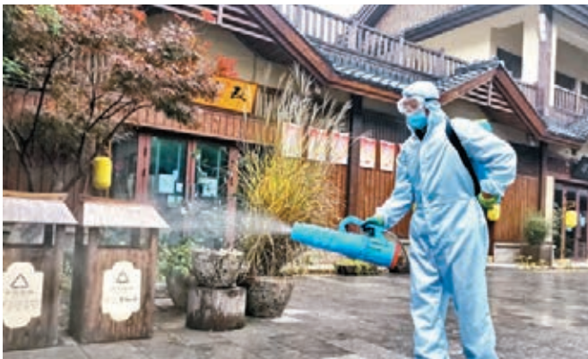
西安相關景區關閉進行消毒。