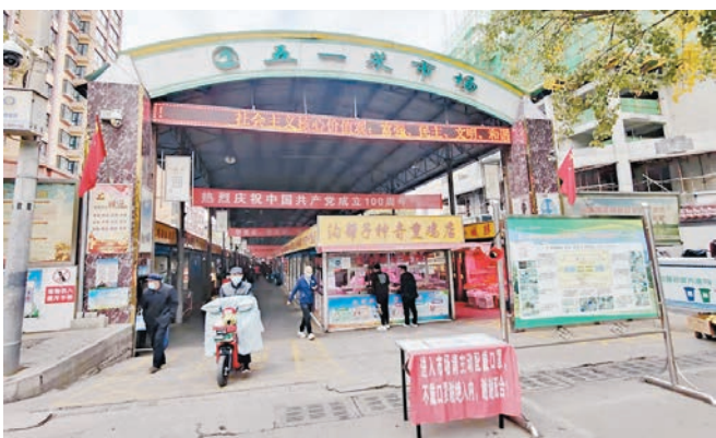
隨着疫情防控全面升級，蘭州菜市場較往日稍顯冷清。

「停業對我們影響挺大的，上次停業後有三分之二的店員離職，這次重開才一個多月，沒想到又被停業。」近兩日，位於西安市大雁塔旁的古法麵新陝菜店因三個月內兩週確診遊客就餐上热搜，店主被網友們稱為「西安最倒霉老闆」。「7月底關門，9月1日開業，也就1個多月，因為上海這對老教授夫婦，現在帶員工的家屬也被隔離。」該店也收穫了網友們的一波安慰，評論區裏滿滿都是加油、鼓勵和安慰的話語。「最倒霉老闆」迎來了一大波「愛心消費」，不少西安當地網友留言，「有機會一定去嚐嚐。」