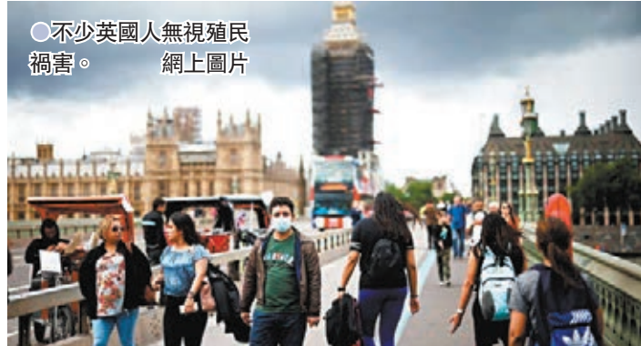
●不少英國人無視殖民禍害。 網上圖片

倫敦國王學院近代史教授威爾遜指出，相比其他前殖民國家的人民，例如比利時、法國和意大利人，英國民眾甚少談及自己國家在殖民時期所犯的暴行，這也使認同殖民歷史的人數比例較其他國家高。