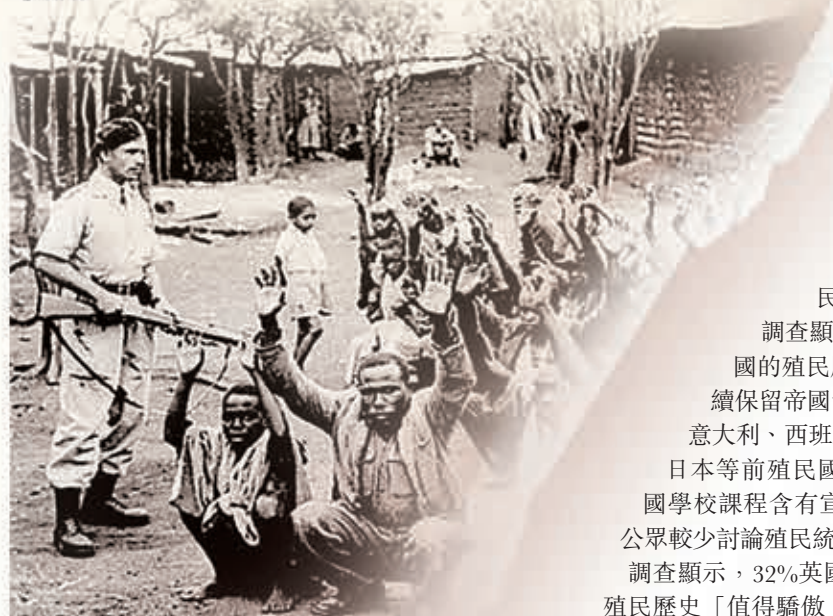
●殖民時期的英國警察在肯尼亞進行搜捕。