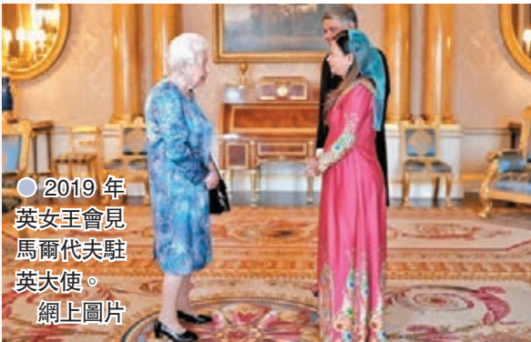
●2019年英女王會見馬爾代夫駐英大使。

英國殖民統治時期的暴行，到後殖民時代仍持續困擾當地，尼國曾發生多次軍事政變，還面對內戰頻仍和恐怖主義肆虐，分析認為這是英國不負責任的管治方式的遺禍。