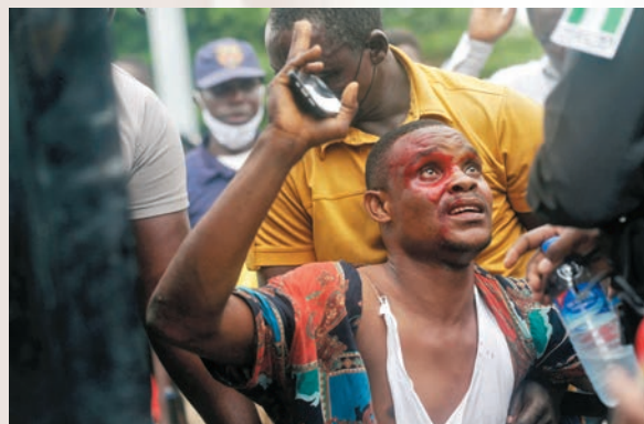
●尼日利亞至今動盪不斷。