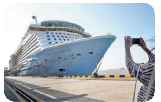
▲「海洋光譜號」船員被列為疑似「復陽」個案，傳染風險微，船上乘客獲放行。圖為「海洋光譜號」。