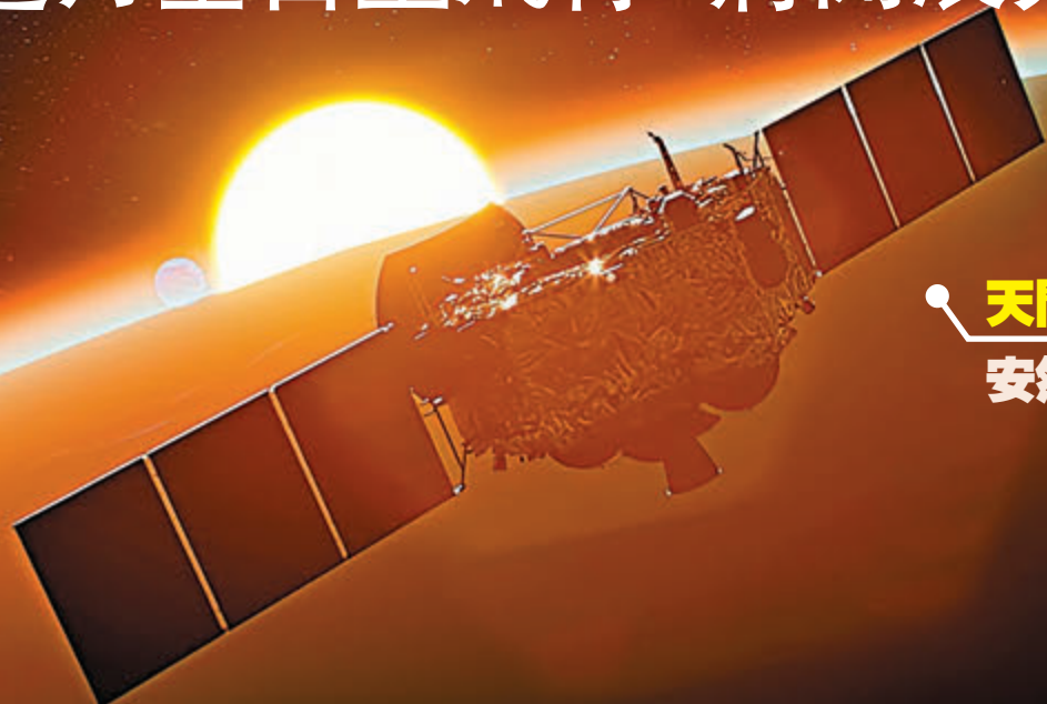
天問一號火星環繞器安然度過日凌模擬圖

香港文匯報訊（記者 劉凝哲 北京報道）2021年9月下旬開始，地球、火星運行到太陽的兩側且三者近乎處於一條直線，這種現象稱作日凌。在此期間，火星探測器與地球的通信受到太陽電磁輻射干擾，出現不穩定甚至中斷。日凌期間，天問一號環繞器和祝融號火星車進入自主運行模式，暫停科學探測工作。日前，天問一號火星探測任務團隊通過地面發令形式，正式將器上狀態設置為「出日凌」，這標誌着火星環繞器順利完成逾一月的全自主飛行，圓滿通過日凌考驗。