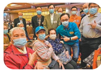
●聶德權與長者在酒樓傾談合照。

另外，政府外展疫苗接種隊昨日到元朗形點 (YOHO MALL)，為街坊提供一站式接種服務。聶德權早上到現場了解情況及打氣，並與在場數位年輕街坊傾談，他們明白遲早都要打疫苗，所以趁着今（昨）天接種地點方便，便來接種。