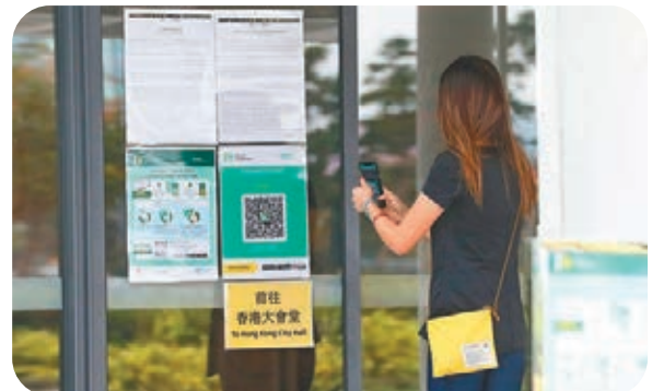
●下月起官立學校必須使用「安心出行」應用程式。圖為香港大會堂外市民使用「安心出行」。

他認為，特區政府要考慮執行行政措施如何能夠覆蓋到使用有關服務的市民，建議用「平常心」去處