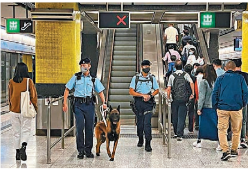
◀警員帶同警犬到港鐵站內巡邏。

另外，運輸署宣布，由23日晚上11時半起，至24日下午4時半，全港多區分階段封路，包括屯門公路往汀九橋南行線、中環灣仔繞道等，超過250條小巴及巴士路線改道或停駛。另外，為配合賽事，首班港鐵將於24日凌晨3時許開出，5條特別巴士路線亦會提早於凌晨4時許提供服務，分別由荃灣、屯門及天水圍，前往尖沙咀及銅鑼灣。運輸署呼籲市民應避免駕車前往受影響地區及盡量改用鐵路服務，並留意最新交通消息。