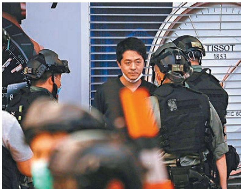
●許智峯涉嫌勾結外國勢力危害國家安全及洗黑錢，被香港警方國安處通緝。圖為許智峯去年在銅鑼灣被捕。