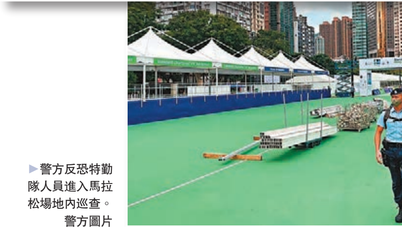
▶警方反恐特勤隊人員進入馬拉松場地內巡邏。