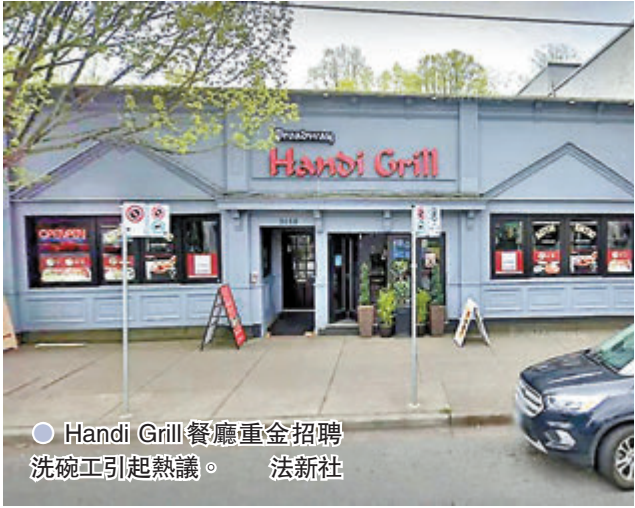
Handi Grill餐廳重金招聘洗碗工引起熱議。

香港文匯報訊(特約記者 成小智 多倫多報導)受新冠疫情影響,全球多個行業正面臨人手短缺問題,其中酒店和餐飲行業的情況尤其嚴重。加拿大溫哥華一間餐廳近日登出一則招聘廣告,以年薪5萬加元(約31.5萬港元)招聘洗碗工,業界人士表示,餐廳廚房相關職位在疫情前已有大量空缺,現時空缺數量更較之前翻倍,高薪招聘進一步凸顯人手不足的嚴峻性。 加拿大食肆給予洗碗工的工資因地區、僱主而異,安大略省最低時薪為每小時14.35加元(約90.2港元),在多倫多任職中餐館的黃先生表示,西餐館的洗碗工工資較佳,中餐館則往往低於最低工資,尤其部分無證移民或領取養老金人士,由於缺乏議價能力,收入會低於