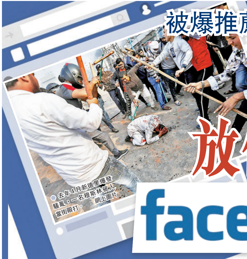
去年4月新德里爆發騷亂,一名穆斯林被人在當街毆打。