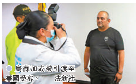
烏蘇加或被引渡至美國受審。

哥倫比亞總統杜克前日宣布,當局成功逮捕該國頭號通緝大毒梟、毒品犯罪集團「海灣幫」的頭目烏蘇加。 哥倫比亞政府前日根據美國及英國提供的情報,派出500名士兵、特種部隊成員、警員以及22架直升機,前往西北部安蒂奧基亞省內科克利郊外,突襲烏蘇加藏身的森林,並突破8層防線,最終將他生擒。行動中最少一名警員殉職。 杜克形容,此次行動是本世紀哥倫比亞毒品打擊行動最重大的一次勝利。杜克還要求包括毒梟在內的犯罪分子主動投降,否則面臨被剿滅的命運。哥倫比亞政府其後公布烏蘇加被捕的畫面。畫面中,烏蘇加身穿黑衣服褲和水鞋,雙手佩戴手扣,被押送至內科克利一個軍事基地示眾。 50歲的烏蘇加是哥倫比亞最大販毒集團「海灣幫」的頭目,也是一個右翼民兵組織