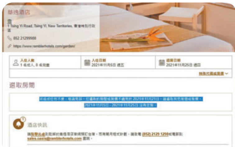
截至昨晚，華逸酒店不少日子預約房間已爆滿。網頁截圖