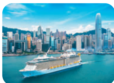
衛生防護中心已要求「海洋光譜號」暫停航程21天，圖為「海洋光譜號」在維港航行。

雖然郵輪公司對停運存在異議，但呼吸系統專科醫生梁子超昨日在接受香港文匯報訪問時指，政府出於全局考慮，停運決定合理。他表示，雖然有關船員有機會是7月感染後的「復陽」個案，但仍不能排除新近感染的可能，因新感染個案亦