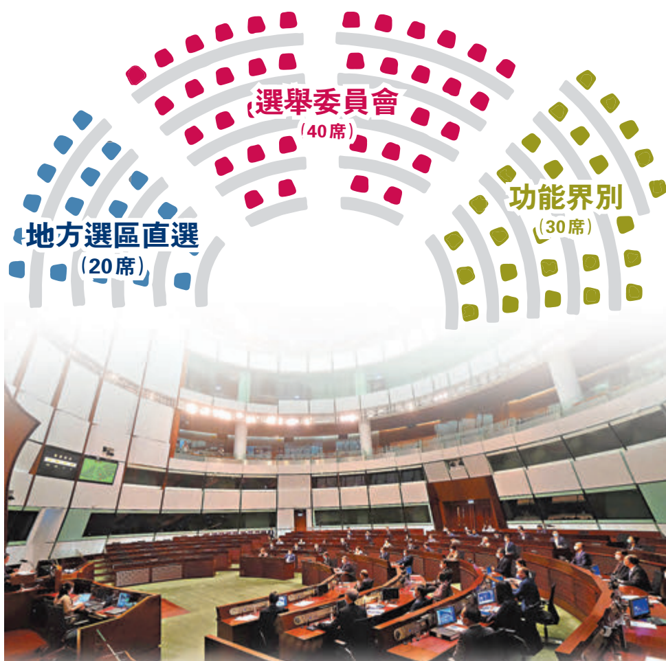
●完善香港特區選舉制度後，2021年立法會換屆選舉即將舉行，為落實「愛國者治港」揭開新篇章。圖為立法會今年5月三讀通過《完善選舉制度》條例。資料圖片