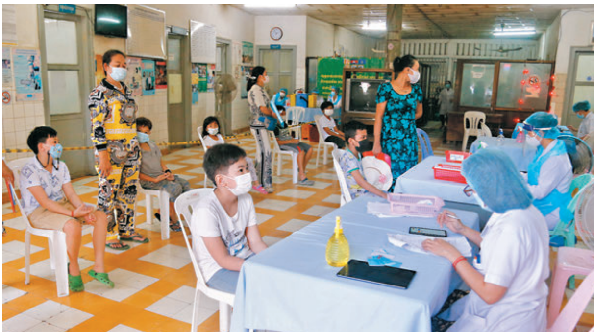
●東埔寨9月下旬起為6歲至12歲兒童接種科興新冠疫苗。