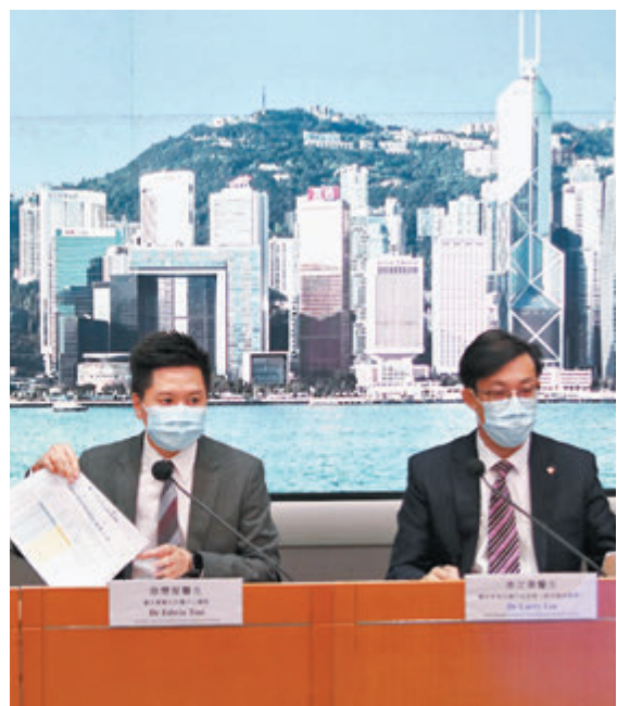
●衛生防護中心總監徐樂堅(左)與醫管局總行政經理李立業(右)。

至於昨日新增的3宗個案，當中兩名女患者分別於上周五及上週日，乘搭EK384班機由巴基斯坦經阿聯酋抵港，她們早前均已接種兩劑疫苗。其餘一宗個案是65歲的男患者，他上週日由新加坡乘搭TR980班機抵港，在機場檢測時驗出攜帶L452R可能變種病毒，他亦已接種兩劑復必泰疫苗。