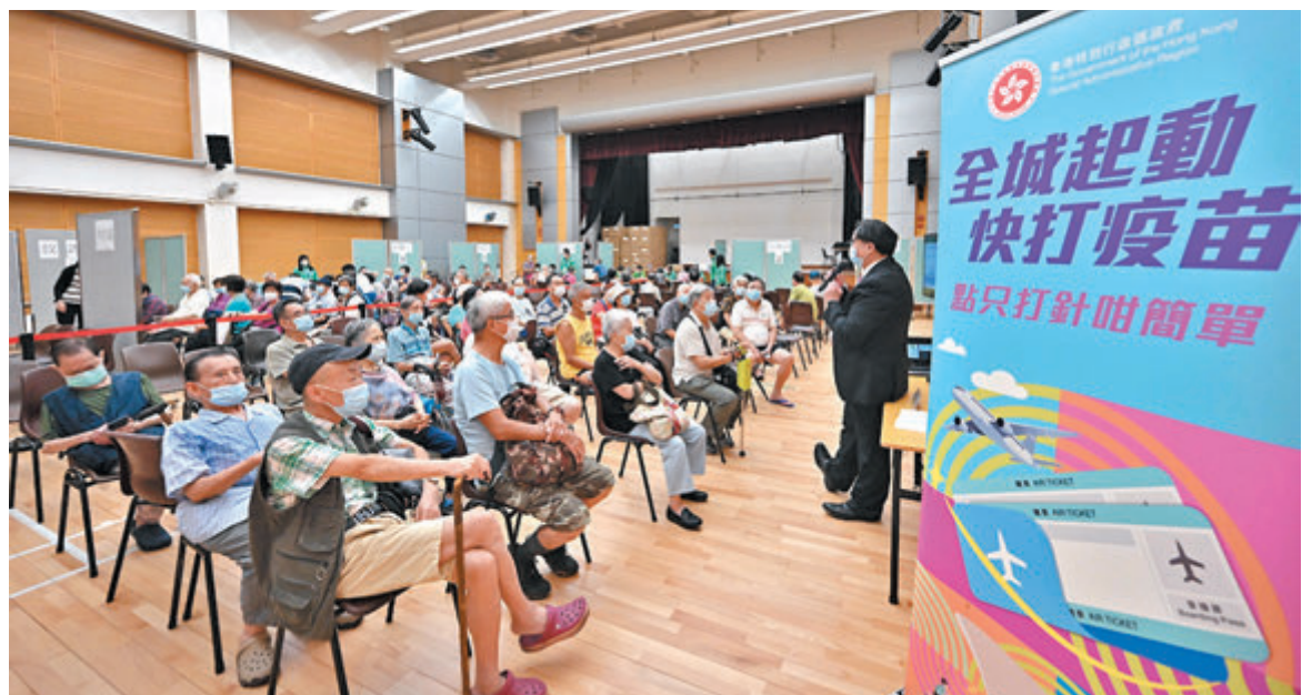
●香港93%新冠重症死亡個案為60歲或以上長者。

至於已接種一劑認可新冠疫苗後獲發醫生證明因健康原因未能接種第二劑疫苗的港人，也可例外獲准從A組指明地區登機返港。抵港後仍須在指定檢疫酒店接受21天強制檢疫，以及於抵港第二十六天進行強制檢測。