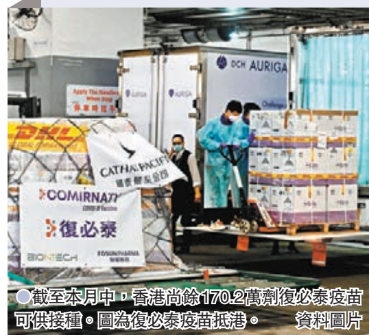
●截至本月中，香港尚餘170.2萬劑復必泰疫苗可供接種。圖為復必泰疫苗抵港。資料圖片

科學委員會正研究降低新冠疫苗接種門檻，預計未來一兩個月後，疫苗接種年齡可擴展至5歲至11歲兒童。崔俊明指出，兒童使用的復必泰疫苗有別於成人版本，需要重新製造及預訂，隨著各國家、地區逐步降低新冠疫苗接種年齡，「大家都要重新搶購兒童疫苗，本港應加快準備工作，爭取在兩個月內有疫苗運抵香港，順利開打。」