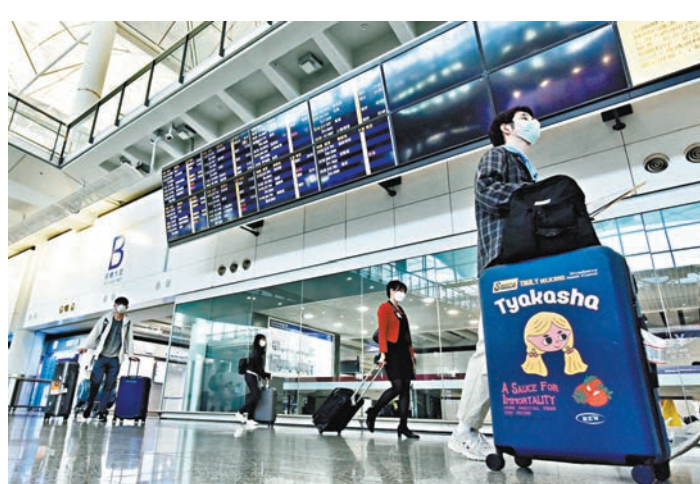
●54歲男貨機機師本周一返港，機場採樣結果呈陽性。圖為乘客抵達香港國際機場。資料圖片

另外，由於阿聯酋航空營運的由阿聯酋迪拜和泰國曼谷飛抵香港的航班(EK384)，於本周一（25日）有3名乘客於抵港檢測時陽性，衛生署遂引用《預防及控制疾病（規管跨境交通工具及到港者）規例》（第599H章），即日起至本月9日期間，禁止該航空公司營運的客機從迪拜和曼谷着陸香港。