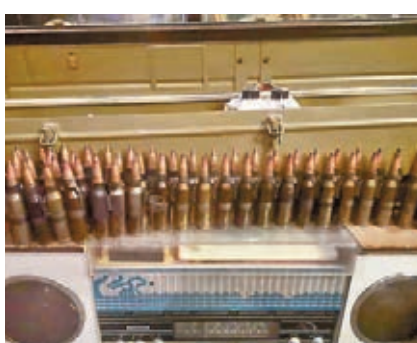
● 延安時期的收藏品