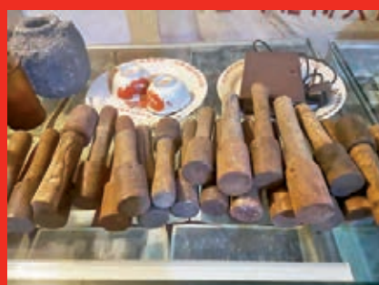
● 紅軍用過的手榴彈