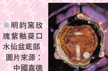
● 明鈞窯玫瑰紫釉葵口水仙盆底部