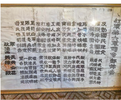
● 紅軍第六軍司令部佈告