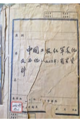
● 紅軍西征珍貴資料