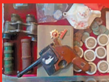
● 戰爭年代使用過的手槍