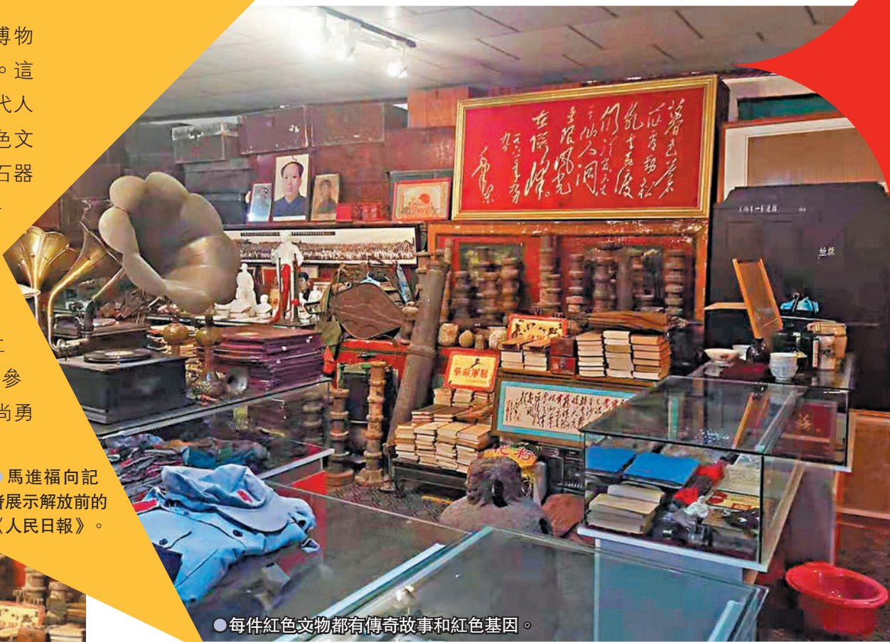
● 每件紅色文物都有傳奇故事和紅色基因。