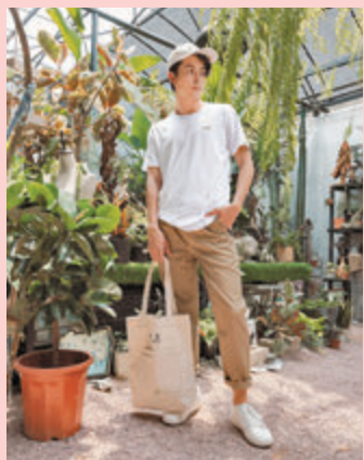
●PEA by PONY服飾圖案