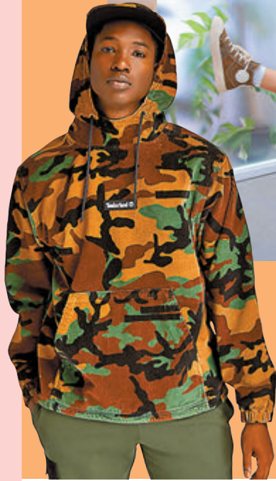
●PEA by PONY系列