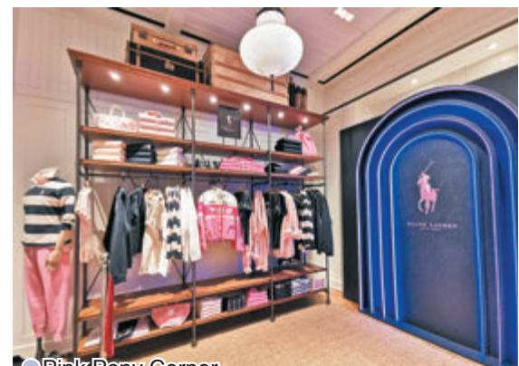
●Pink Pony Corner

日前，Ralph Lauren宣布於香港開設全新Polo Ralph Lauren專門店，新店反映品牌洋溢年輕活力的經典美式風格，長春藤校園風、大學運動元素，以至戶外運動項目等經典美國文化圖騰，融入新店的建築元素中。質樸的橡木地板和牆身的木嵌板，與懸吊式層架、古董和仿舊陳列架及櫃檯，以及風格多元的藝術品和擺設，交織成一個既典雅亦怡然的空間，兼具時尚型格與年輕活力，反映品牌一貫的風格。