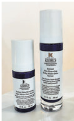
●醫學淡紋緊緻再生精華設兩種容量選擇。

A醇(Retinol)具備獨特的抗皺力量，能促進表皮皮膚更新，恢復肌膚密度及緊緻度，但亦因它效力強大，使用含有A醇的產品也會帶來副作用，如肌膚乾燥、明顯泛紅及脫皮等。為此，Kiehl's推出全新醫學淡紋緊緻再生精華(Retinol Skin Renewing Daily Micro Dose Serum)，以微精準技術來活用A醇，其配方能釋出精準的劑量，擊退7大肌膚問題，如減退皺紋、細緻毛孔、緊緻提升、撫平細紋、柔嫩膚質、均勻膚色、煥活肌膚。同時，將傳統A醇配方產生的副作用減到最輕，即使在首兩星期使用時，也不會令人不適。