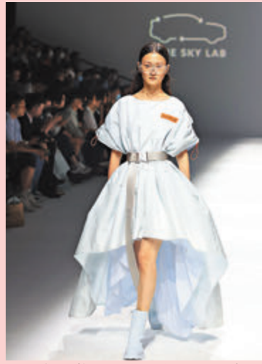
●上海時裝周上，發布環保品牌BLUE SKY LAB系列時裝。