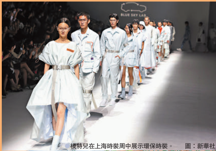
模特兒在上海時裝周中展示環保時裝。