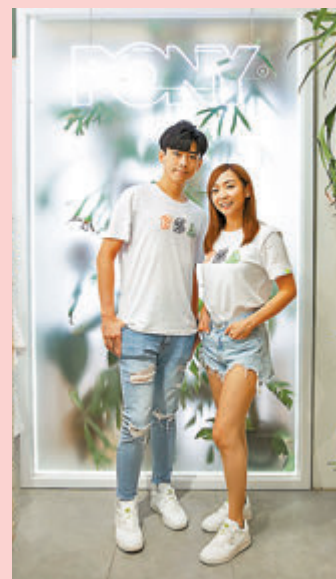
●限定店以Upcycling為設計概念，打造一幅特色打卡牆。

早前，潮流波鞋品牌PONY於大南街設立香港首間POP UP STORE，展示全新環保系列PEA by PONY波鞋及服飾單品系列，以PEA簡單三個字設計，P表示「PONY、People、Planet」，帶出品牌、人類及地球，有着環環相扣的關係，E代表「Environment」，即以環境保護為設計重心，A則是「Awareness」，希望透過系列令更多人注意環保問題。這系列由包裝至產品均採用具認證的再生及可持續物料製造，鞋面採用環保純素皮革或回收再造帆布取代傳統物料；鞋底物料由混合環保料，例如輪胎、舊鞋、膠樽等壓碎製成；而鞋墊則由可生物降解的生物基碳泡沫或再生塑料製成。系列鞋履共有五款，並以高筒帆布鞋、帆布鞋、波鞋等鞋款為主，而配色則以白色及大地色為主調，風格簡約清新，容易配搭不同造型穿著，秉承環保潮流結合生活的核心理念。