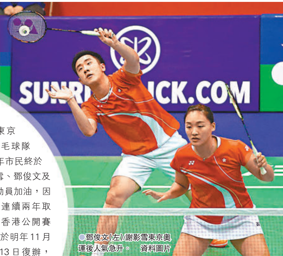
●鄧俊文(左)謝影雪東京奧運後人氣急升。

香港文匯報訊 (記者 郭正謙) 東京奧運後一眾香港羽毛球隊成員人氣急升，下年市民終於有機會現場為謝影雪、鄧俊文及伍家朗等明星級運動員加油，因疫情連續兩年取消的香港公開賽有望於明年11月8至13日復辦，相信屆時將會掀起一波羽毛球熱潮。