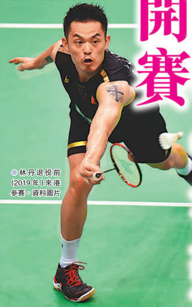
●林丹退役前(2019年)來港參賽。資料圖片

為了備戰世錦賽，國羽在結束蘇迪曼盃、湯優盃以及丹麥公開賽4項大賽後，集體缺席本周的法國公開賽、下周的德國公開賽以及11月的兩站印尼賽事，啟程回國，進行封閉集訓。10月初的蘇迪曼盃，中國隊第13次奪冠；隨後湯優盃奪冠，湯孟獲得亞軍。