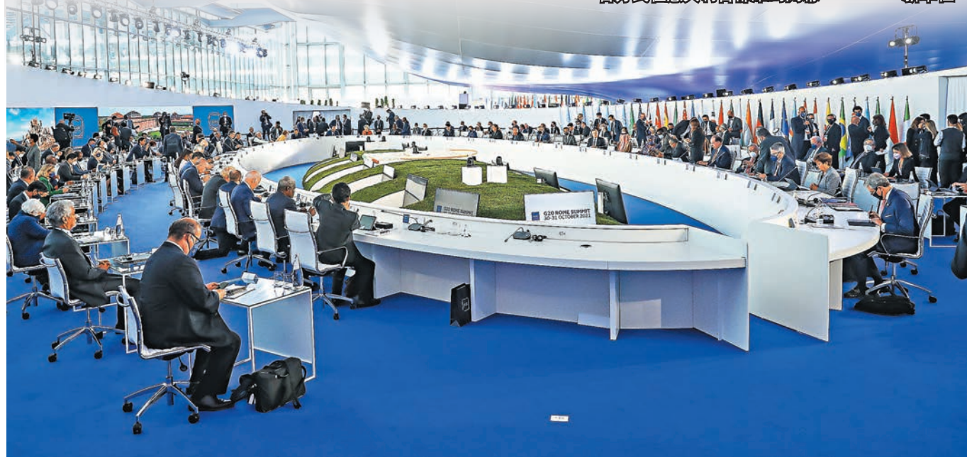
○二十國集團領導人峰會30日以線上線下相結合方式在意大利首都羅馬開幕。