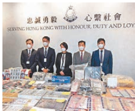
●警方交代「沉雷行動」詳情。

香港文匯報訊（記者 蕭景源）東九龍黑幫操控遊戲機中心、毒品飯堂及無牌酒吧，利用社交平台推廣黃賭毒「一條龍」服務，以無限供應毒品作招徠，更可用電子支付找數，吸引青少年光顧及從事違法活動。警方前晚開始一連兩天展開「沉雷」行動，出動500警力搗破10間經營非法賭博的遊戲機中心，15間提供百家樂、釣魚機、啤牌等的地下賭場、毒品飯堂及無牌酒吧。行動中，警方凍結了黑幫4個本地銀行戶口和一個儲值支付工具戶口內140萬港元，共拘捕265人通緝57人。