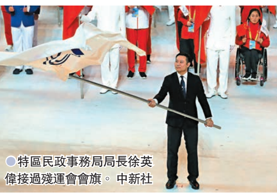
特區民政事務局長徐英偉接過殘運會會旗。

本屆殘特奧於本月22日在西安開幕,共有4,484名殘疾人運動健兒進行了43個大項47個分項的角逐,共超36項世界紀錄,創179項全國紀錄。