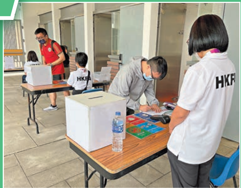
球迷日後入場可不再填表。

至於昨日傑志對香港U23之戰,前者排出只有陳肇鈞及安永佳兩位港生球員的正選陣容,