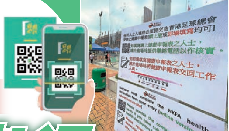
足總設計的健康申報表將成歷史。

香港文匯報訊(記者 黎永淦)康樂及文化事務署本月29日(周五)宣布,明起進入康文署的辦公處所和轄下場地,除了獲豁免人士外,所有人士必須使用「安心出行」流動應用程式掃描場所二維碼,才獲批准進入。這亦意味着除了非康文署管轄的港會場,今季餘下所有香港超級足球聯賽的比賽場地,所有入場人士,包括球隊職、球員、足總及負責賽事有關人士以及入場觀眾等,都要遵守這項規定。