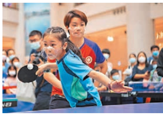
杜凱瑛與恒生乒乓球學院小學員互相切磋。

香港文匯報訊(記者 陳曉莉)為慶祝恒生銀行與香港乒乓球總會攜手同行30年,「恒生乒乓球學院·全民乒乓嘉年華」昨起一連兩日在奧海城舉行。香港乒乓球代表隊教練李靜和高禮澤聯同代表隊成員包括杜凱瑛、蘇慧音、李皓晴、黃鎮廷、林兆恒和何鈞傑等人,現場與市民近距離接觸,分享比賽經歷和個人心得。