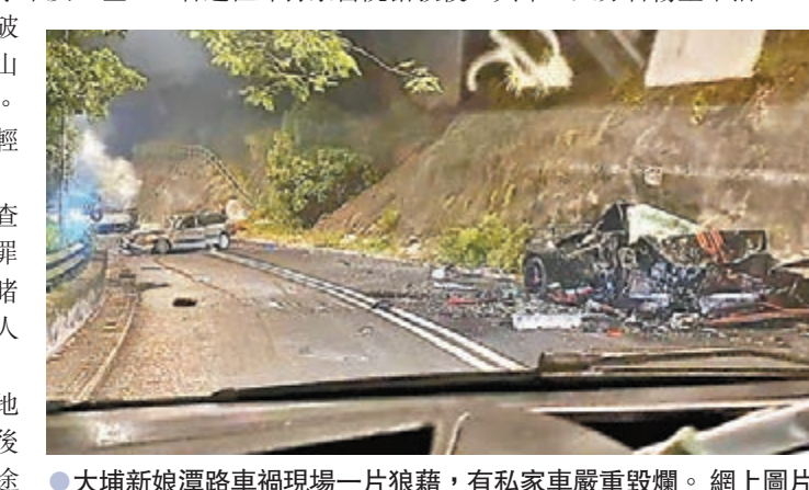
●大埔新娘潭路車禍現場一片狼藉，有私家車嚴重毀爛。

此外在晚上10時許，包括一輛林寶堅尼超級跑車在內的3輛私家車與一輛電車在新娘潭路近鳳坑家樂徑入口相撞，其中一輛私家車四輪朝天冒煙，超級跑車亦嚴重毀爛如廢鐵，現場一人被困車內當場死亡，另外5名傷者送往那打素醫院搶救後，其中一人亦告傷重不治。