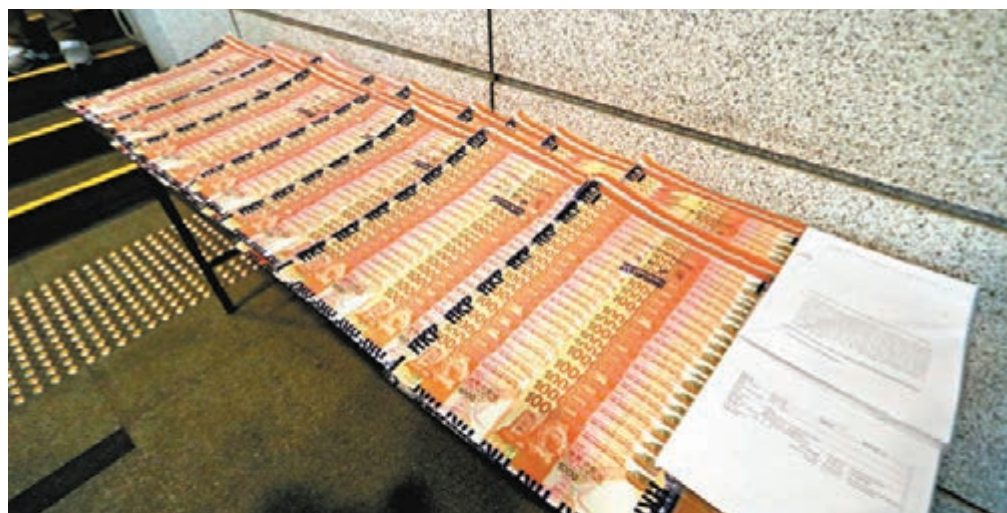
●警方展示行動起回的大量現金及一批按揭貸款文件。

警方財富情報及調查科財富調查組隨即介入調查，發現該筆巨款為一宗樓宇按揭貸款，並迅速聯絡到女事主，女事主此時才察覺放在家中的樓契不翼而飛，且否認有向財務公司申請按揭貸款。警方遂不動聲色，翌日(10月29日)派員到中環的目標某銀行進行埋伏監