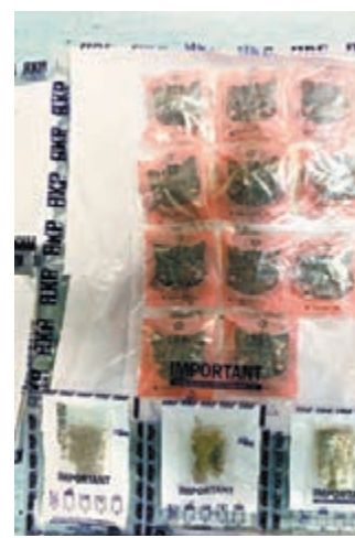
●警方在行動檢獲由大麻製成的曲奇餅(上)及大麻(下)。

香港文匯報訊(記者 蕭景源)萬聖節前夕，警方為保護青少年免受不法分子利用作販運危險藥物及濫藥的違法活動，採取連串反罪惡行動。其中沙田警區展開的「守苗行動」，在馬鞍山拘捕一名駕駛私家車販運大麻、大麻製成的曲奇餅以及大麻油的19歲少女，檢獲毒品總值近15萬元。另又在沙田區內兩間違規營業的派對房間，拘捕一名違反「限業令」的負責人，及向27名違反「限業令」的年輕顧客，發出定額罰款通知書。