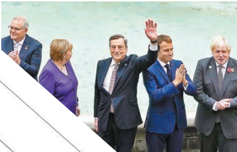
●左起澳洲總理莫里森、德國總理默克爾、意大利總理德拉吉、法國總統馬克龍和英國首相約翰遜在羅馬著名許願池合影。