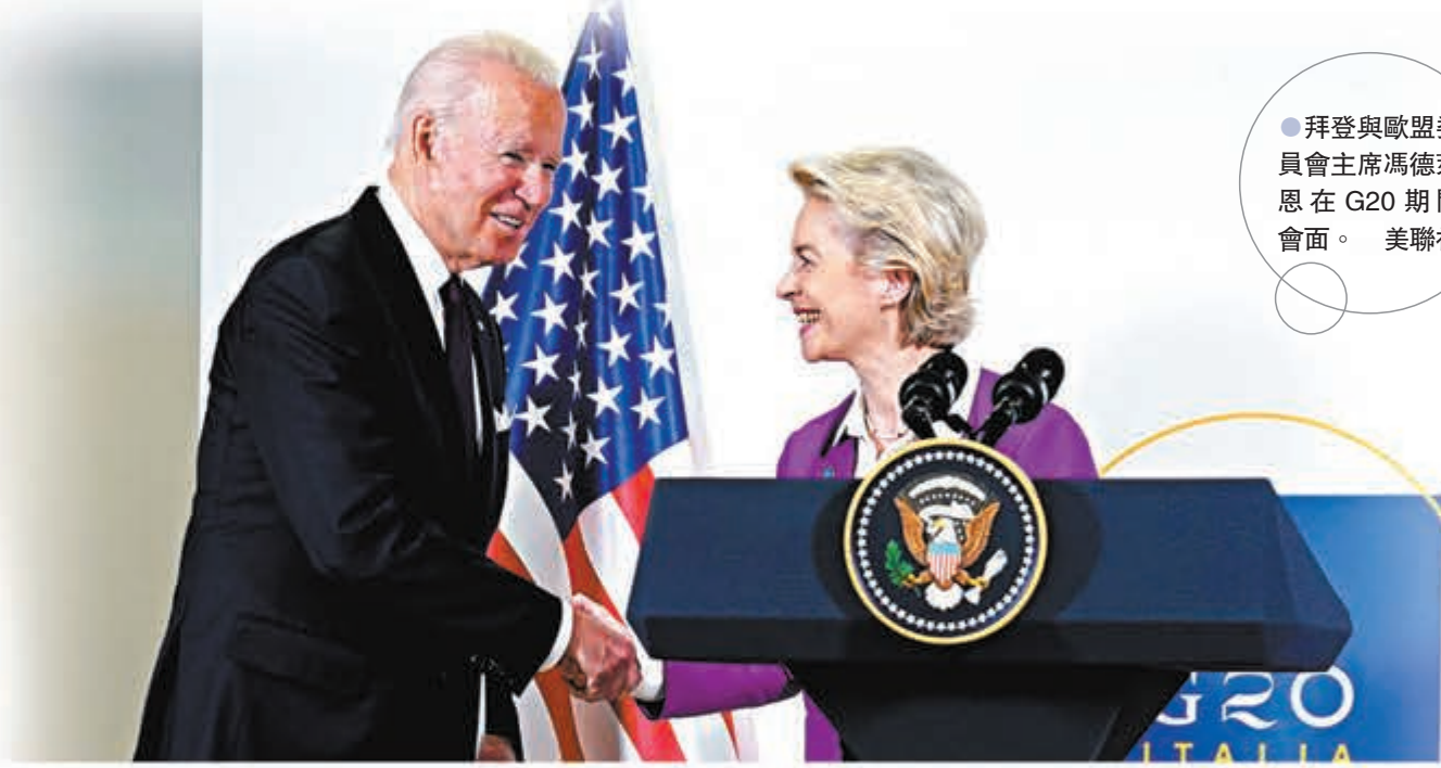
●拜登與歐盟委員會主席馮德萊恩在G20期間會面。

在為期兩天的二十國集團(G20)峰會上，與會領導人同意支持經濟合作與發展組織(OECD)簽訂的15%的全球最低企業稅率協議，以期於2023年生效。不過最新分析則顯示，富裕國家將成為這項稅率協議的「主要贏家」，估計最低稅率產生的1,852億歐元(約1.67萬億港元)額外稅收中，大多數都將流入富裕國家，當中美國單獨就佔了512億歐元(約4,605億港元)，足足是中國估計所能得到的34億歐元(約306億港元)的15倍。