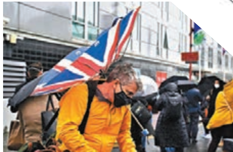
●格拉斯哥遭遇雷雨天氣。