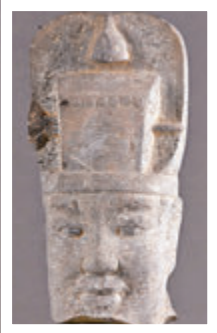
●天井出土的石人頭。

一千多年前一個陽光明媚的春天，大唐長安繁華熱鬧，透過熙熙攘攘的人群，情竇初開的太平公主一眼便相中了清新俊逸的翩翩少年薛紹。然而命運無常，兩人牽手相伴8年後，大唐風雲突變，駙馬薛紹猝然之間銀鐐入獄淒然餓斃，太平公主含淚被迫改嫁，讓人不勝唏噓。2019年11月，長埋咸陽一千三百多年的薛紹墓重現人間，出土的120餘件（組）文物及墓誌彌補了薛紹「有史無傳」的缺憾，香港文匯報記者訪問了陝西省考古研究院研究員、薛紹墓考古發掘負責人李明，讓他帶領我們一窺太平公主和「大唐第一駙馬」的淒美愛情，感受僭越墓制下掩蓋的那段波詭雲譎的歷史。 ●文、攝：香港文匯報記者 李陽波 西安報道