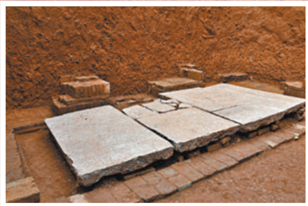
●薛紹墓後墓室安放棺槨的石台。