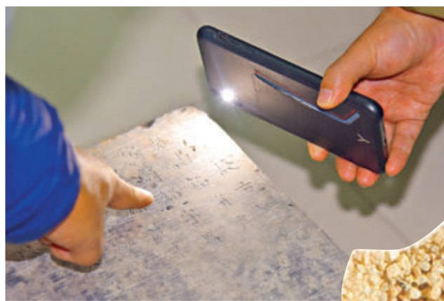
●出土墓誌上的薛紹二字清晰可見。

一千多年前一個陽光明媚的春天，大唐長安繁華熱鬧，透過熙熙攘攘的人群，情竇初開的太平公主一眼便相中了清新俊逸的翩翩少年薛紹。然而命運無常，兩人牽手相伴8年後，大唐風雲突變，駙馬薛紹猝然之間銀鐐入獄淒然餓斃，太平公主含淚被迫改嫁，讓人不勝唏噓。2019年11月，長埋咸陽一千三百多年的薛紹墓重現人間，出土的120餘件（組）文物及墓誌彌補了薛紹「有史無傳」的缺憾，香港文匯報記者訪問了陝西省考古研究院研究員、薛紹墓考古發掘負責人李明，讓他帶領我們一窺太平公主和「大唐第一駙馬」的淒美愛情，感受僭越墓制下掩蓋的那段波詭雲譎的歷史。 ●文、攝：香港文匯報記者 李陽波 西安報道