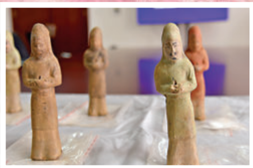
●薛紹墓壁龕出土的陶風帽俑。