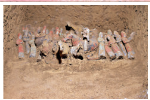
●薛紹墓陪葬有大量的陶風帽俑。