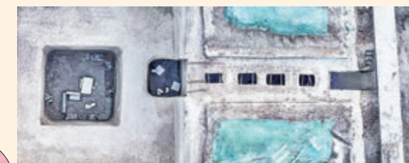
●薛紹墓擁有明顯僭越的4天井。受訪者供圖

何為神龍模式？李明表示，武則天退位後，唐中宗開始為武則天當政期間被殺的李唐宗室平反。除了尋找後人、恢復官爵之外，具有顯著儀式性的程序，就是通過拔高墓葬等級和豪華葬式，來宣揚李唐統治的正統性。薛紹墓之後，神龍二年中宗為他的兒子懿德太子和女兒永泰公主，也修建了超越等級的墓葬，獲得了大唐皇室的大力支持，之後更是大行其道。