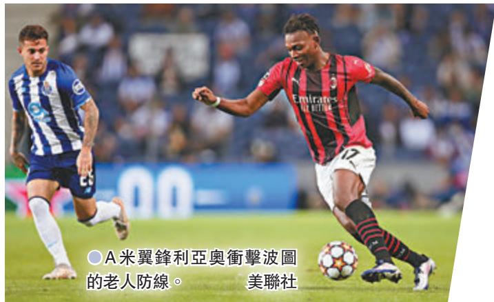
●A米翼鋒利亞奧衝擊波圖的老人防線。

利物浦在後防定海神針華基爾雲迪積克復出後本賽季重拾霸氣，但穩健的防線卻在日前英超迎戰白禮頓一役「老貓燒鬚」，意外地被逼和2:2，車路士趁機帶開榜首優勢至3分，緊接聯賽利物浦還要火拚佔據前四的韋斯咸，加上月中國際賽期後的密集比賽，「利記」當然希望在歐聯能盡早鎖定出線權。他們頭3輪連挫AC米蘭、波圖及馬德里體育會，積9分獨佔鰲頭，領先身後的馬體會與波圖5分，餘下2個主場與1場作客中只要多取3分便幾可肯定穩奪出線權。