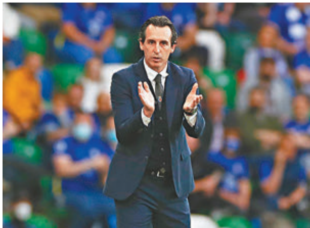
●艾馬利盛傳獲紐卡素垂青。