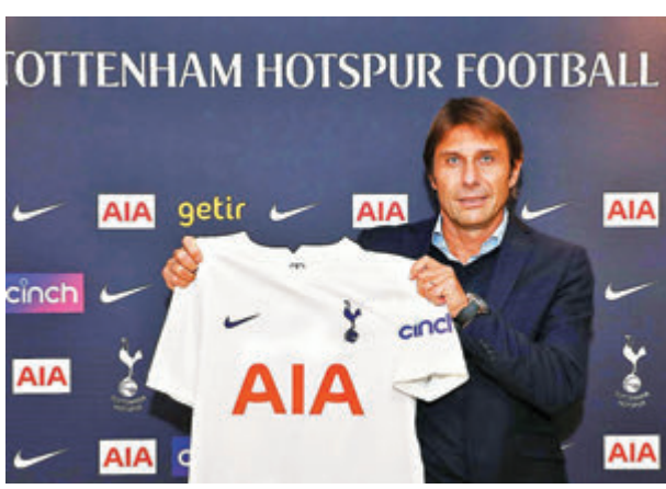
●干地正式成為熱刺的新任領隊。熱刺官網

另一位著名教練艾馬利亦有望再戰英超，盛傳獲得紐卡素方面的垂青。紐卡素上月迎來擁有石油資本的新班主，炒了績差的主帥布魯士；而艾馬利執教西維爾以至現在維利爾的盃賽成績，和在阿仙奴的英超領軍經驗，都是紐卡素看中的優勢。