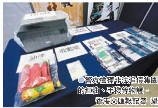
警方檢獲非法追債集團的紅油、字機等物證。

到這些無牌借貸人，並提供個人和親友資料包括住址，借到款項由數千到一萬元不等，但這些非法借貸往往每周會被收取約10%的高息，一旦債仔無法還債，借貸人就會委託這個追債集團追債，每單付酬約1,000元。警方提醒市民應審慎理財，勿向非正規財務公司借貸。