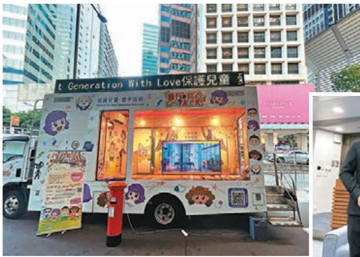
警方的宣傳車會巡迴全港，推廣保護兒童訊息。