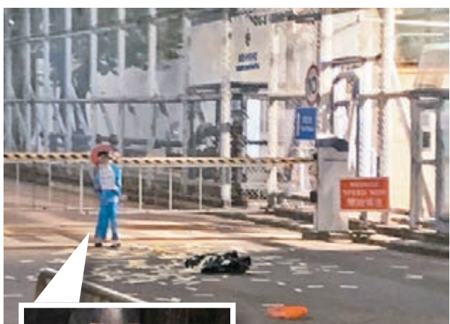
疑黑幫挑釁荔枝角收押所，撒溪錢放債紙公仔。 網上圖片