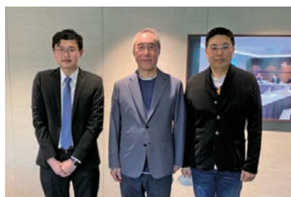
●莊紫祥博士拜訪全國政協常委、西九文化區管理局董事局主席唐英年（中）。