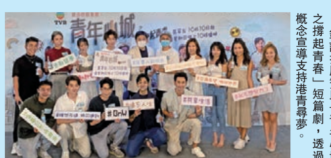
●銀迅控股贊助「青年心城之撐起青春」短篇劇，透過概念宣導支持港青尋夢。

莊紫祥博士相信，只要香港把握好深港合作新機遇，開創合作新天地，以新前海作為香港融入國家發展大局的重要切入點，把握日益龐大和對質量要求不斷提升的中國內地市場，善用國家發展的東風，將可以加速走入國家內循環發展的快車道，以此促進香港的繁榮發展，並為港人提供一個更加廣闊的發展平台，創造一個更加美好、錦繡、光明的未來。