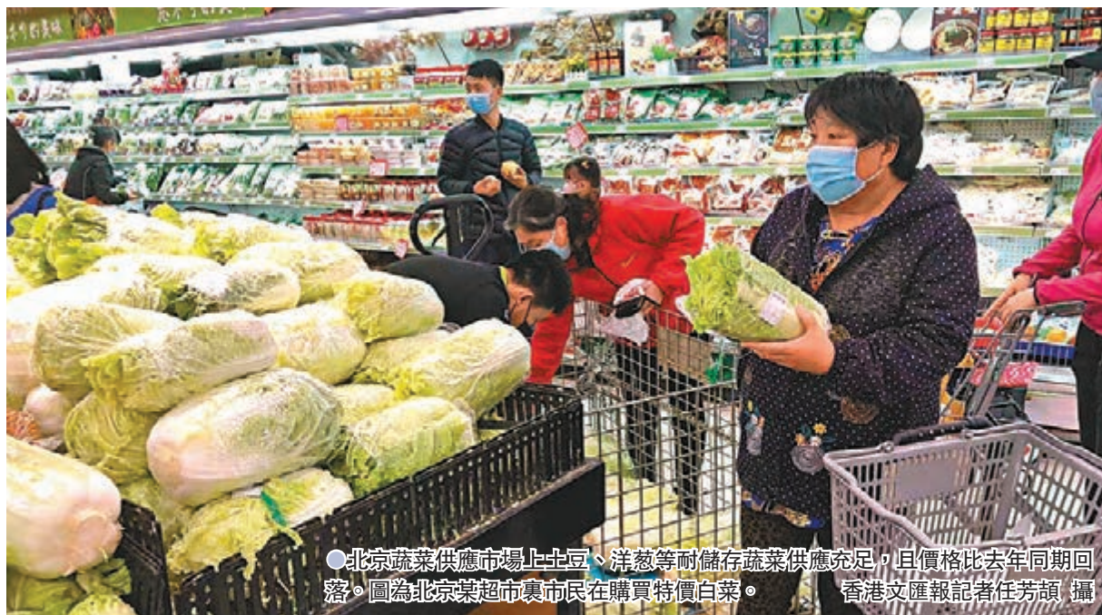
北京蔬菜供應市場上土豆、洋葱等耐儲存蔬菜供應充足,且價格比去年同期回落。圖為北京某超市市民在購買特價白菜。

香港文匯報訊(記者 任芳頤 北京報導)對「鼓勵儲存一定生活必需品」的誤讀,令內地部分地區出現民眾搶購潮,儘管商務部和中央媒體相繼發聲闢謠,部分民眾採購糧油熱情依然高漲,甚至有極端消費者一次購買600斤大米的現象。為此,農業農村部4日在發布會上表示,今年糧食產量將創歷史新高,連續7年穩定在1.3萬億斤以上,產量豐、庫存足,供給完全沒有問題。不少專家認為,商務部只是正常建議表述,市民不必跟風,應理性採購。各大商超亦稱米麵糧油等必需品價格穩健備足,會「適度降價做促銷」。