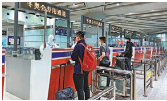
北京入出境邊防檢查總站開通專用通道做好涉冬奧人員入出境查驗工作,全力確保冬奧會疫情安全。

道流入境內,流向內腹地區;加強封凍界江界河值守管控,嚴防人員踏冰非法越境。嚴厲打擊跨境違法犯罪活動,深入推進集中打擊妨害國(邊)境管理犯罪專項鬥爭,開展破壞邊境物防技防設施違法犯罪專項打擊,嚴打海上走私偷渡活動,嚴防跨境違法犯罪帶入疫情。