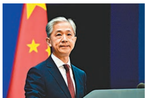
● 外交部發言人汪文斌

「美方此類舉動嚴重損害全球戰略穩定,破壞國際和平與安全。中方敦促美方切實承擔起核裁軍的特殊優先責任,繼續以可核查、不可逆和有法律約束力的方式,進一步大幅、實質