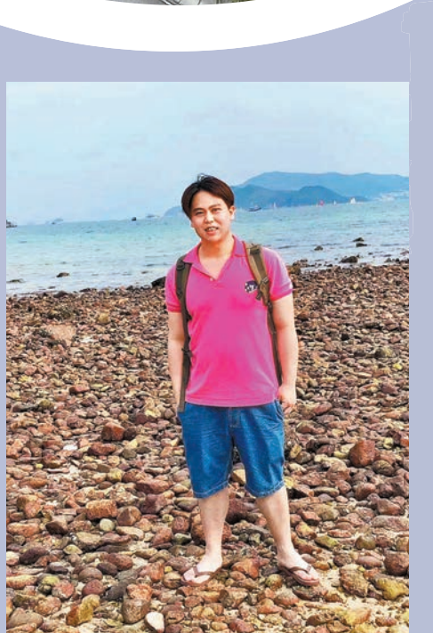
○王先生從事貨櫃碼頭物流工作。

在他眼中，上進投效的成本過高，回報卻十分有限，「香港的物價實在是太高，迫於家庭壓力，但嚟要好搏命先可以賺到足夠妻子女兒生活的錢，努力確實可以搵多啲，但付出是否抵得上回報呢？」