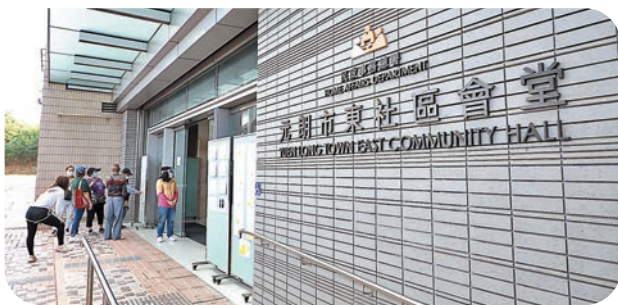
●昨日有兩間社區檢測中心電腦系統出現故障，分別是元朗市東社區會堂（左圖）及屯門兆麟社區會堂檢測中心（右圖）。