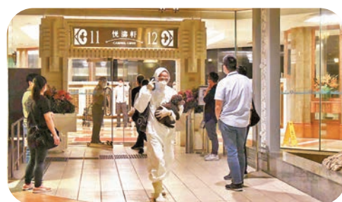
●第四波疫情確認映灣園外備與印度裔男子的病毒基因相同。圖為映灣園進行強檢。資料圖片

進一步增加處理量和速度，協助衛生防護中心建立病毒監測網，以應付可能出現的新一波疫情。他又提到，團隊最近更建立了病毒基因地理資訊系統，將個案的病毒基因、確診時間、患者行蹤等，以互動地圖的方式呈現。相信此系統有助防疫追蹤，令圍封檢測等防疫措施更精準地實施，為日後正常通關締造有利條件。