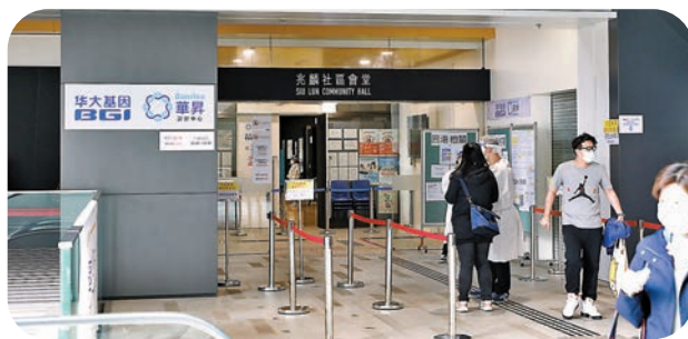
●昨日有兩間社區檢測中心電腦系統出現故障，分別是元朗市東社區會堂（左圖）及屯門兆麟社區會堂檢測中心（右圖）。

香港文匯報訊（記者 文森）昨日位於元朗及屯門的兩間社區檢測中心電腦系統出現故障，中心簽發的紙質檢測報告因此缺少化驗所標誌和簽名。部分市民原本計劃拿到報告後立即前往內地，但受電腦故障影響等候逾3小時都未「拎到紙」，延誤行程。涉事的社區檢測中心運營商表示，系統已於昨日中午12時半前修正，機構正在調查錯誤原因，確保不會再出現。