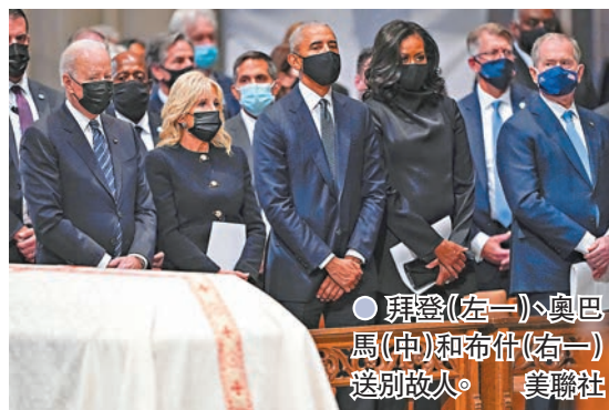
● 拜登(左一)、奧巴馬(中)和布希(右一)送別故人。