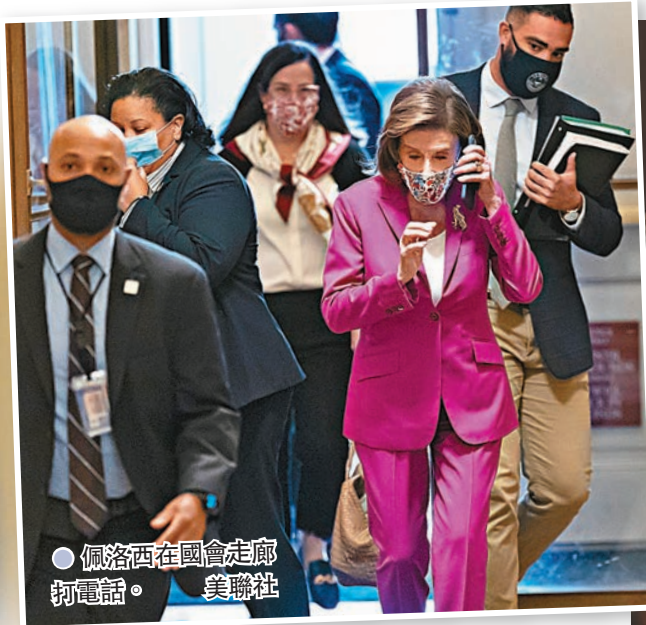
● 佩洛西在國會走廊打電話。