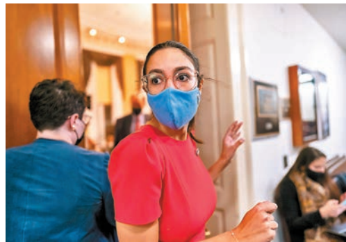
● 議員奧卡西奧-科爾特斯出席閉門會議。

自拜登就職以來，基建和福利法案一直是其力推的「標誌性工程」，但這兩項法案在眾議院的