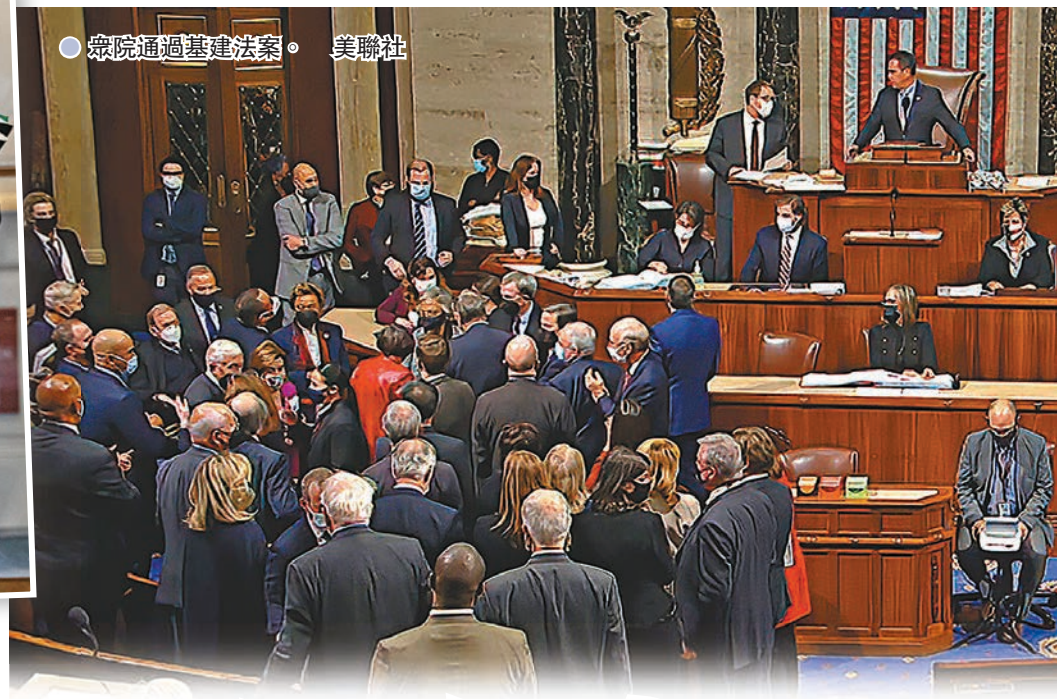
● 眾院通過基建法案。