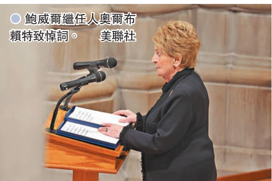
● 鮑威爾繼任人奧爾布賴特致悼詞。