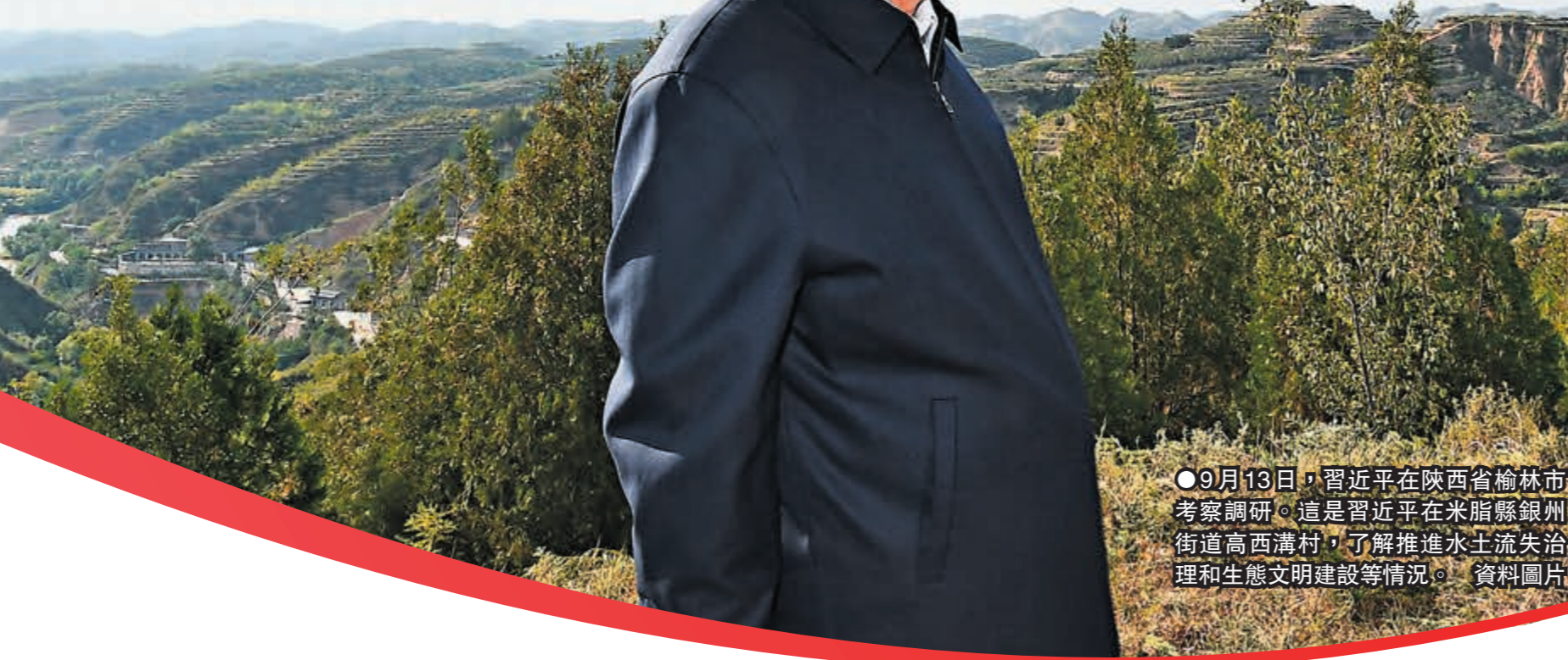
●9月13日，習近平在陝西省榆林市考察調研。這是習近平在米脂縣鎮州街道高西溝村，了解推進水土流失治理和生態文明建設等情況。

在慶祝中國共產黨百年華誕的熱烈氛圍中，在「兩個一百年」奮鬥目標的歷史交匯期，中國共產黨迎來又一次意義重大的盛會。