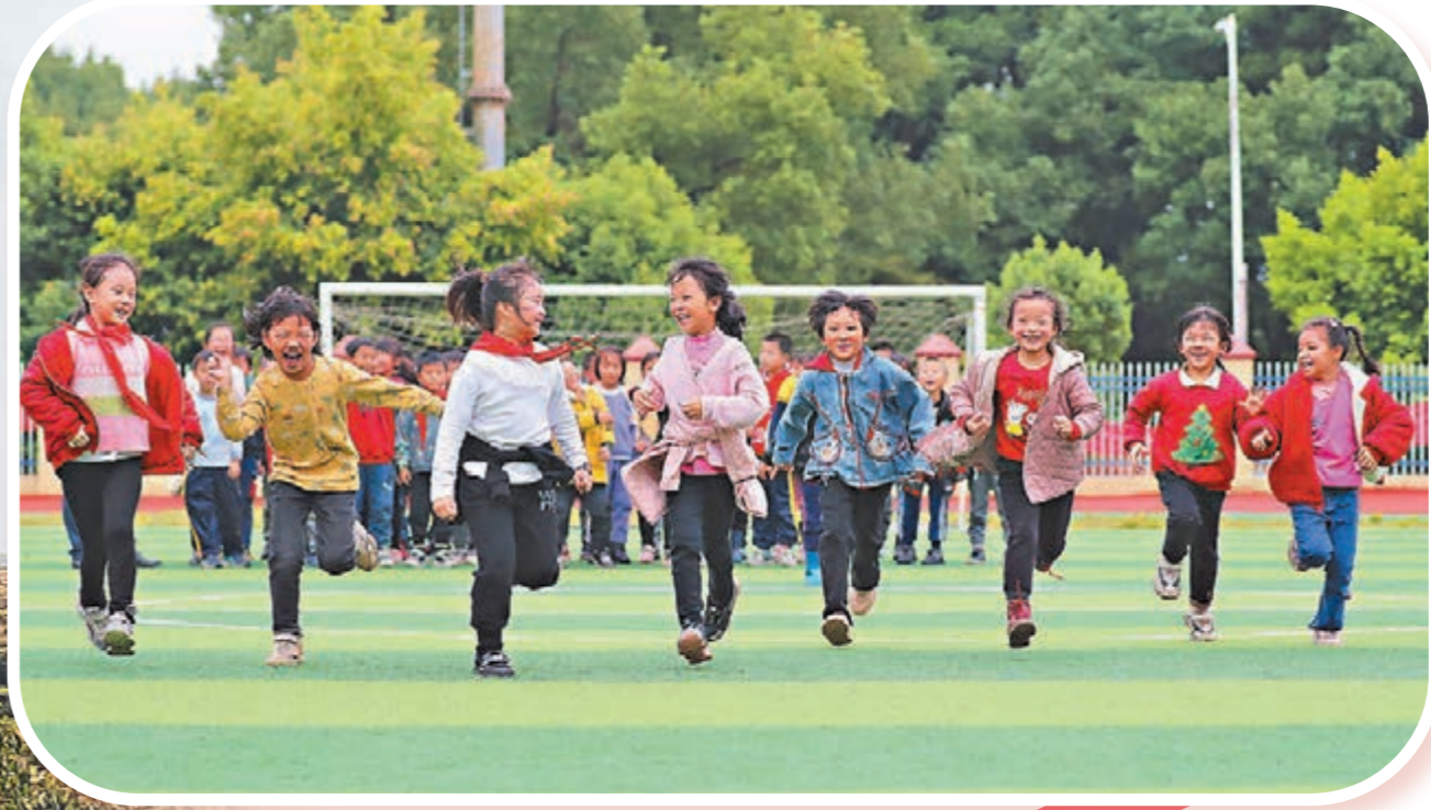
▲11月4日，在湖南省永州市新田縣雙碧小學，孩子們在運動場上做遊戲。今年秋季學期開學以來，各地積極落實「雙減」政策，利用課後服務時間開展內容豐富、形式多樣的課外活動，促進學生全面發展。 資料圖片