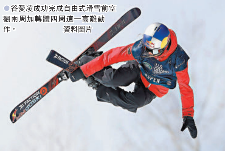
● 谷愛凌成功完成自由式滑雪前空翻兩周加轉體四周這一高難動作。 資料圖片

11月7日是中國農曆十月初三，立冬。正在為北京冬奧會進行衝刺階段訓練的谷愛凌通過社交媒體發文稱：「想念北京的烤鴨和餃子。」