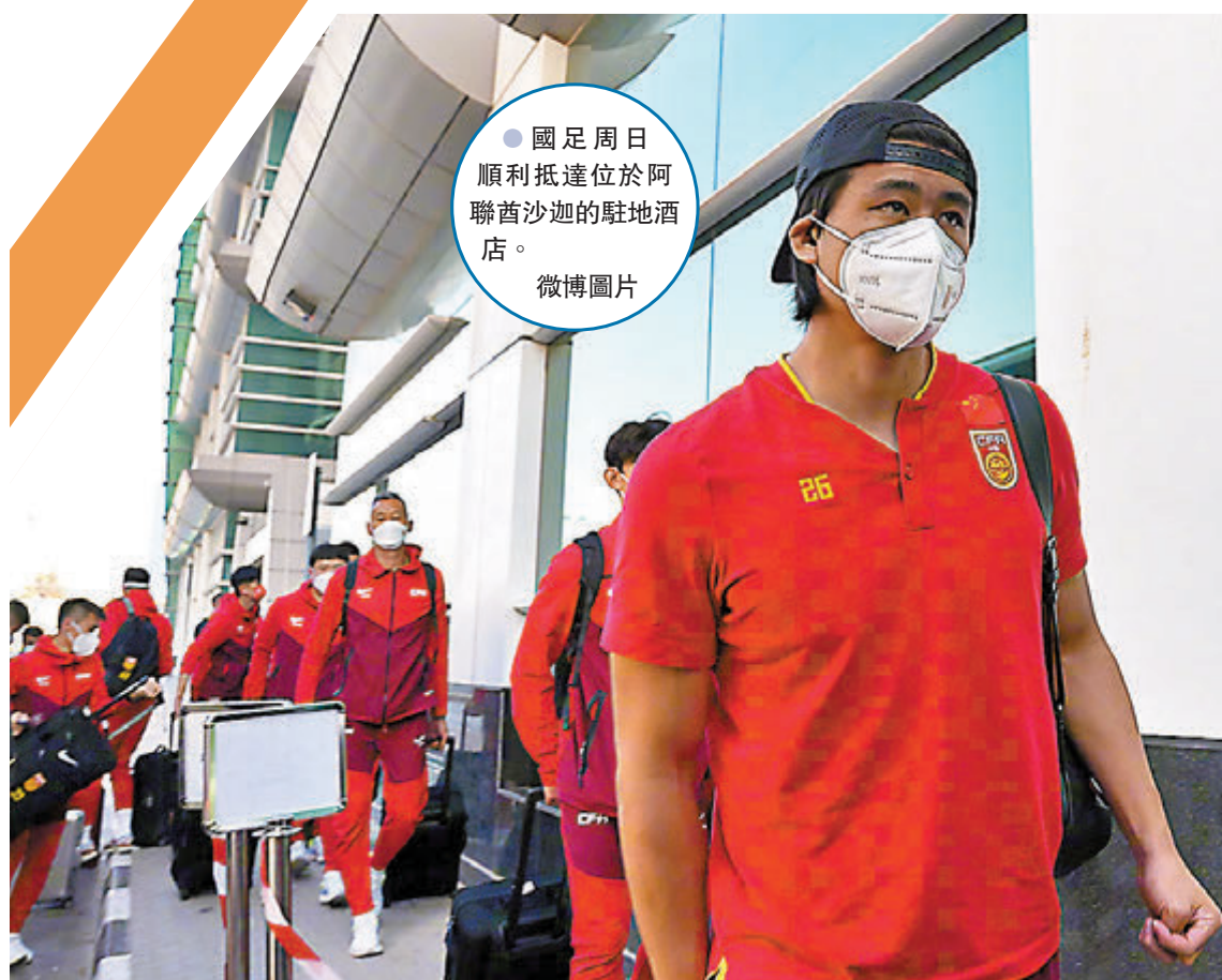
● 國足周日順利抵達位於阿聯酋沙迦的駐地酒店。