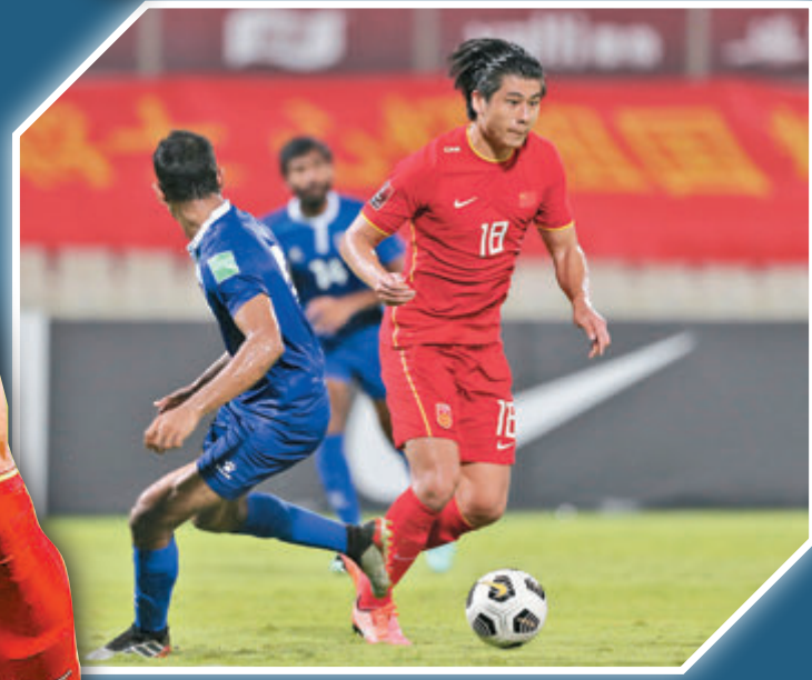
● 武磊於當地時間8日凌晨與國足會合。 資料圖片

受新冠疫情等因素影響，國足主場對阿曼和澳洲的兩場12強比賽移至沙迦舉行。經過9個半小時的漫長飛行後，眾將士在香港時間周日上午10點45分抵達阿聯酋沙迦。於機場接受並通過核酸檢測後，全隊在「隔離泡泡」防疫中到達當地酒店，並於即晚到球場進行適應訓練。於西甲効力的武磊因為球會比賽的關係，於當地時間8日凌晨才與球隊會合。