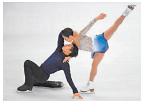
● 隋文靜/韓聰（左）在加拿大大獎賽奪冠。 法新社

很多困難的時刻，不能和親朋好友見面，也許今天見一次，下次就不知道是什麼時候了。所以我們也希望這座橋搭在每一個人之間，給彼此溫暖。就像奧林匹克格言新加入的內容——『更團結』。」 ●新華社