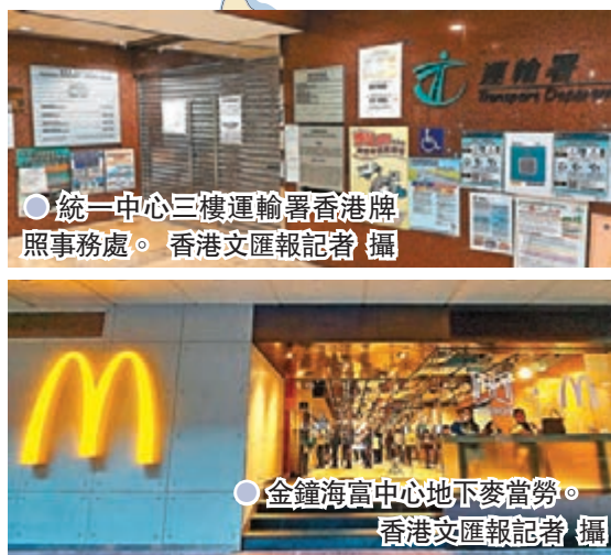
●統一中心三樓運輸署香港牌照事務處。香港文匯報記者 攝