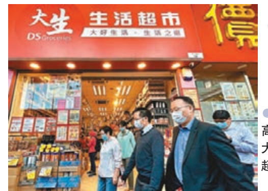
●銅鑼灣高士威道大生生活超市。中新社