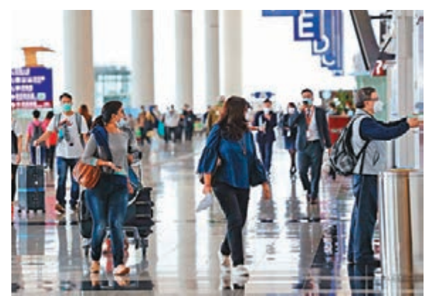
●政府宣布提升新西蘭的風險評級至B組指明地區，下周三生效。圖為香港國際機場。