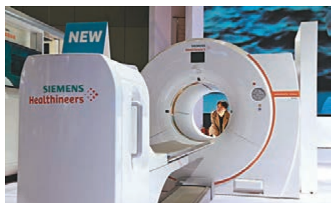
●第四屆進博會意向成交金額達到707.2億美元。圖為西門子醫療在第四屆進博會全球同步首發超高端極光PET/CT新品。

香港文匯報訊(記者倪夢瑤上海報道)第四屆中國國際進口博覽會10日正式落下帷幕。根據進博局公布的數據顯示,按一年計,第四屆進博會意向成交金額達到707.2億美元,儘管因受疫情等因素影響,較上屆略降2.6%,但在這個全球性的舞台上,越來越多的世界展商希望把握中國機遇,主動加入進博「朋友圈」許下「進博之約」。在接受香港文匯報採訪時,眾多展商表示已經簽約第五屆進博會,更有展商稱將加快落地中國項目,進博效益持續溢出。