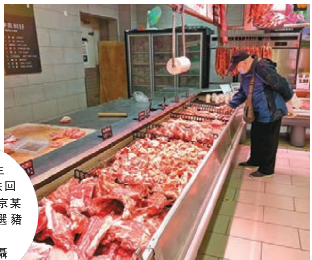
▶10月以來生豬價格出現止跌回升現象。圖為北京某超市市民在挑選豬肉。