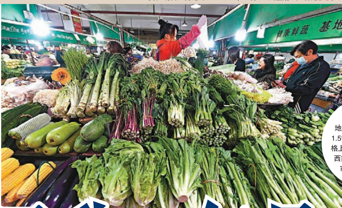
●10月份,內地CPI同比上漲1.5%。其中,鮮菜價格上漲15.9%。圖為廣西南寧市民眾在農貿市場選購蔬菜。

香港文匯報訊(記者海巖北京報道)10月蔬菜等價格大漲,推動內地居民消費價格指數(CPI)同比增速超預期上升。國家統計局10日發布數據顯示,10月CPI同比上漲1.5%,增速較9月回升0.8個百分點,略高於市場預期,為2020年9月以來最高水平。