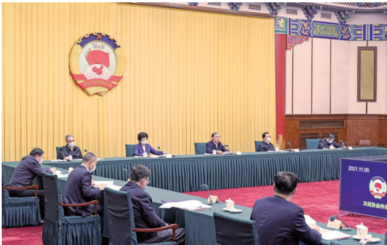
十三屆全國政協第56次雙周協商座談會近日在北京召開。中共中央政治局常委、全國政協主席汪洋主持會議。