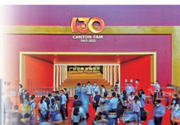
10月15日，第130屆中國進出口商品交易會在廣州舉行。廣交會被譽為中國外貿的「晴雨表」和「風向標」。

全國政協委員、上海海關關長高融昆表示，對比世界最高標準，對照國際經貿規則最新趨勢，環顧新冠肺炎疫情全球大流行出現的新形勢，我國貿易便利化仍有大量工作要做。當前，口岸系統承擔了很多政府不該管也管不了的事務，制約了貿易便利化水平的提