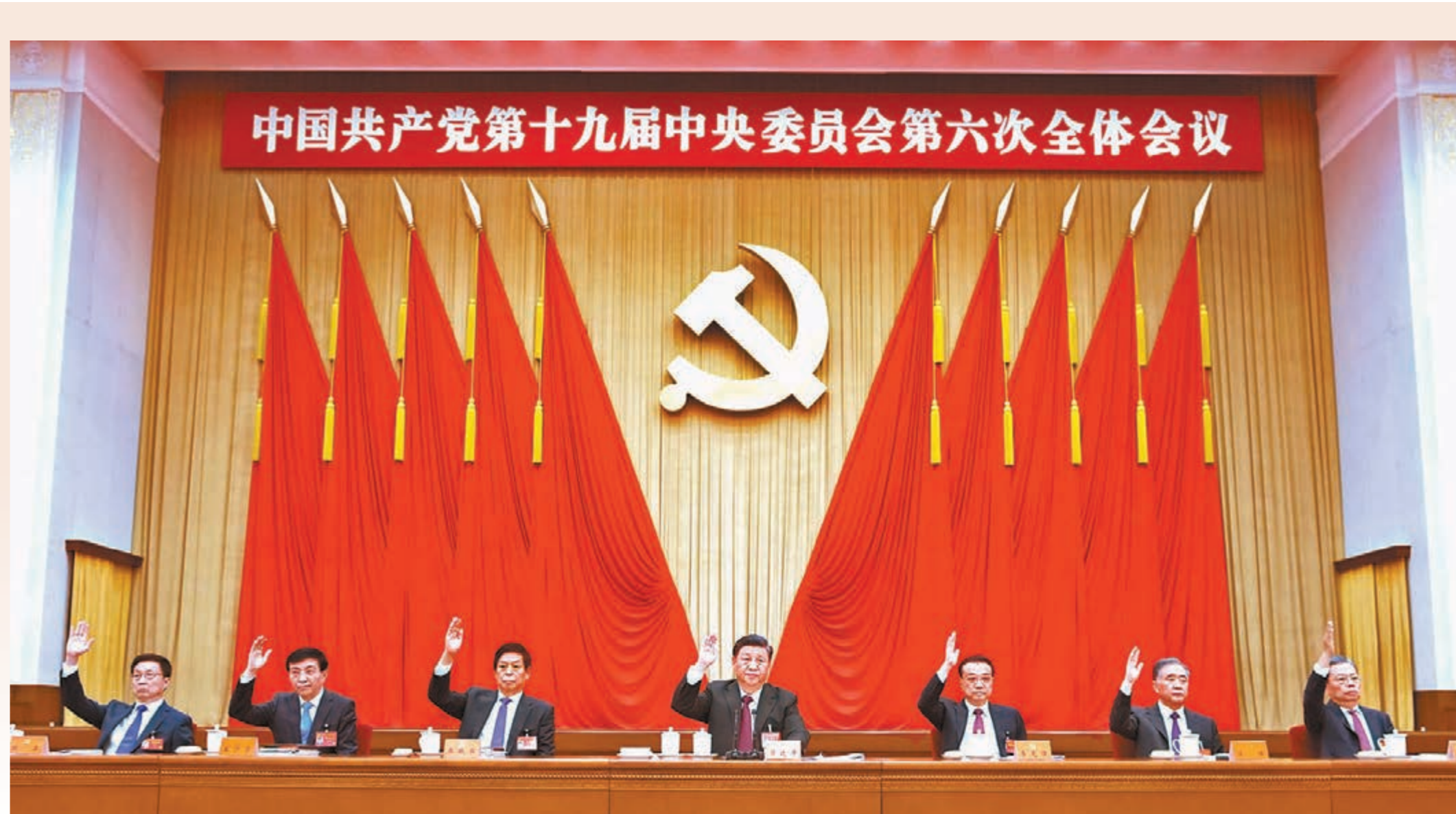
●習近平、李克強、栗戰書、汪洋、王滬寧、趙樂際、韓正等在主席台上。