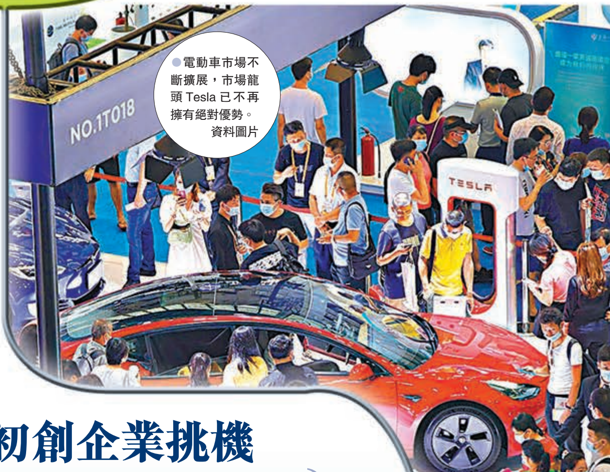
●電動車市場不斷擴展，市場龍頭 Tesla 已不再擁有絕對優勢。資料圖片

Rivian 目前仍在虧損，自去年初以來累計虧損逾 20 億美元（約 155.8 億港元），截至上月底僅售出 53 輛汽車，但該公司表示，伊利諾伊州廠房每年最多可生產 15 萬輛電動車，並計劃下月推出一款 7 座位的電池驅動 SUV。投資者對其前景非常看好，估值甚至超過福特汽車，更認為該公司將成為電動車巨擘 Tesla 的勁敵。亞馬遜已於 2019 年與 Rivian 簽訂協議，訂購 10 萬輛電動送貨車，將在 2030 年前交付。