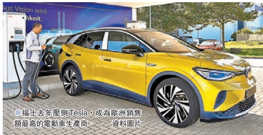
●福士去年壓倒Tesla，成為歐洲銷售額最高的電動車生產商。資料圖片