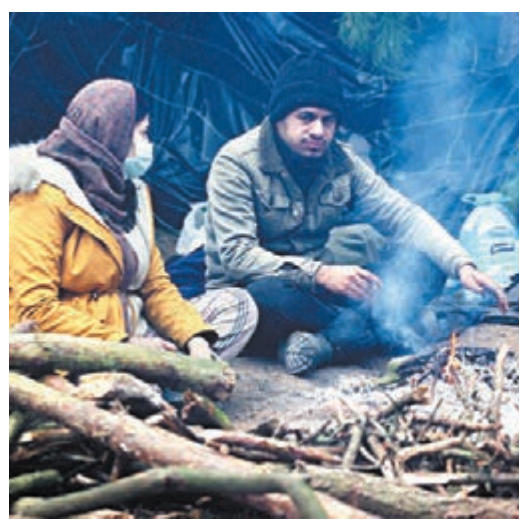
●大批難民仍逗留當地。