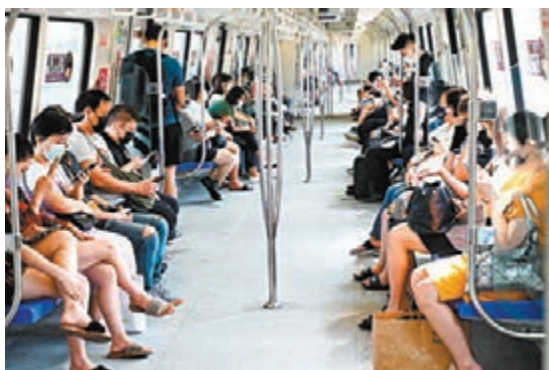
●新加坡推出簡約設計的「綠色通行證」。法新社所，當局特意在「綠色通行證」介面加入海獺動畫圖案，方便場地人員檢視。不少網民歡迎當局今次更新，並大讚加入海獺這項設置，稱「我喜歡那隻海獺，可確保介面不會是截圖」。