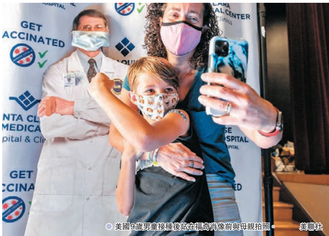
●美國9歲男童接種後站在福奇肖像前與母親拍照。

每10人患一般感冒時，便有1人是由冠狀病毒引起。領導研究的斯沃德林指出，那些未有感染新冠的醫護，他