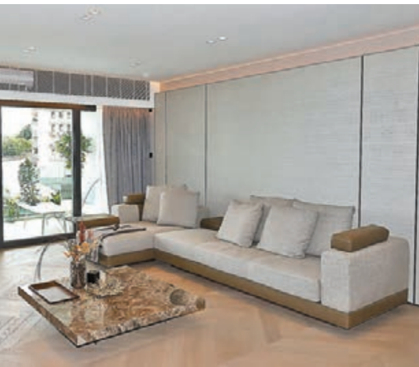
是次的麗景園豪宅設計單位，不但簡單潔淨，更兼具個性與大宅氣派。