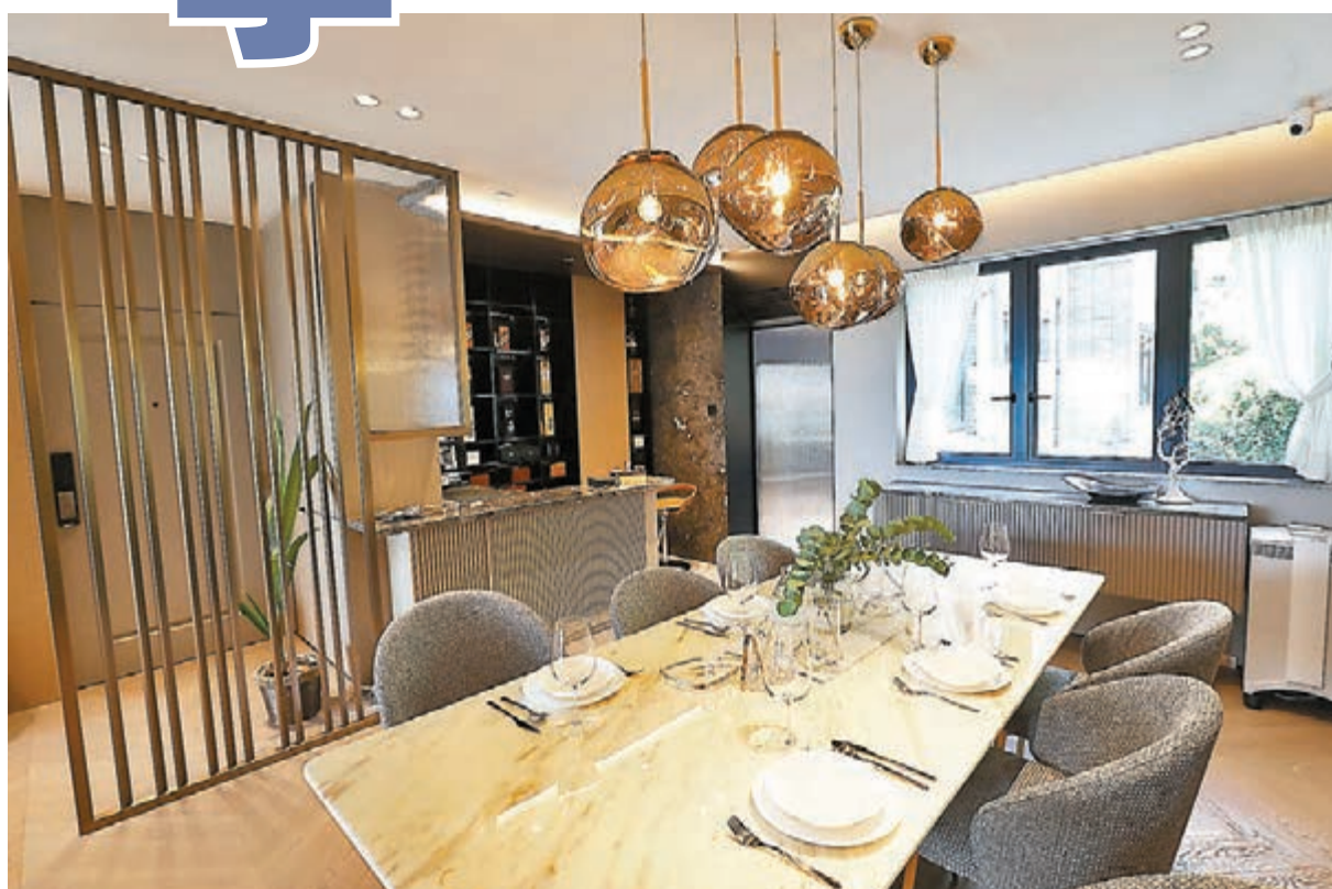
●飯廳的特色吊燈與大理石長形飯桌，配上金屬物料和弧形條子牆身，營造出豪華的美感。

餐桌旁的位置，因應戶主需要打造了一個吧枱空間，閒時小酌兩杯外，亦有一個黑色層架放置名貴美酒。吧枱灰色的大理石材質，與飯桌的淺色大理石做出呼應，配搭一點黑色的金屬元素，整個空間看上去陽剛有型。飯廳旁邊是廚房位置，設計師運用長虹玻璃做了一個分隔門，令客廳的陽光可以透過玻璃間隔到達廚房的空間。廚房用上一款貴族藍的膠板，與白色