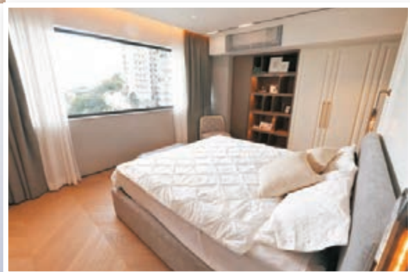
●主人房睡眠區放下巨型雙人床並可三邊落床，旁邊更設有暗門通往洗手間。