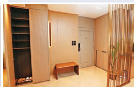
●玄關運用了通透的設計及條子元素，減低進門後的壓迫和侷促感。