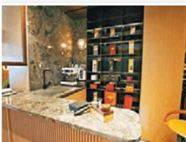
●吧枱的大理石材質，配搭黑色的金屬元素，看上去陽剛有型。