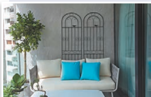
●客廳旁的露台能引入自然光，是單位的一個焦點點所在。