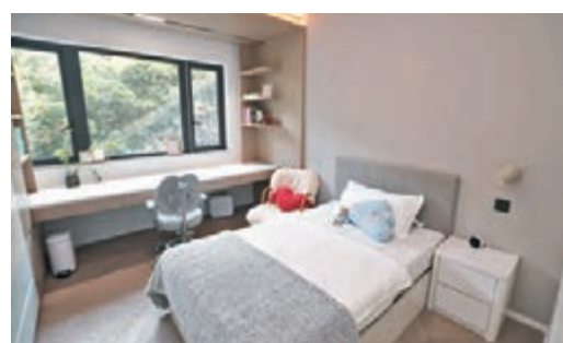
●大女兒的房間不僅設有一張大書枱，更有大量的儲物空間。