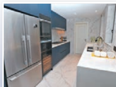
●廚房以貴族藍的膠板與白色牆身做配襯，更顯時尚貴氣。