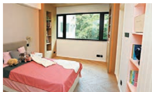
●小女兒房間則以淡粉紅和白色配搭，並加入木飾面的元素。