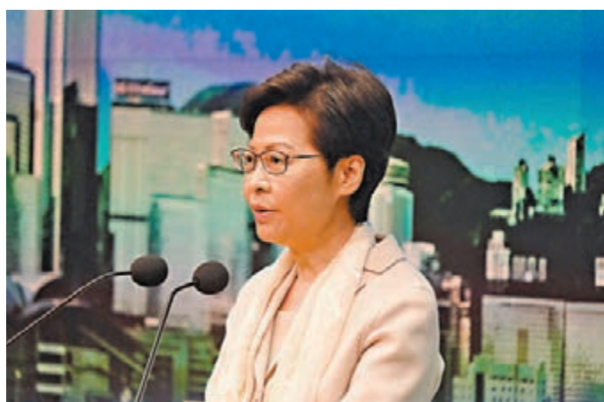
●特首林鄭月娥表示，機師返港後確診染疫並沒有影響和內地商談通關事宜。

香港文匯報訊（記者 費小輝）3名貨機機組人員抵港後相繼確診，令社會擔心會否再次對與內地恢復正常通關造成障礙。香港特區行政長官林鄭月娥表示，事件並無影響與內地商討恢復正常通關的事宜，一切籌備工作仍在進行中。她強調必須在防疫與保持香港正常運作之間取得平衡，「如果突然完全沒來貨，不知道這個社會如何運作。」