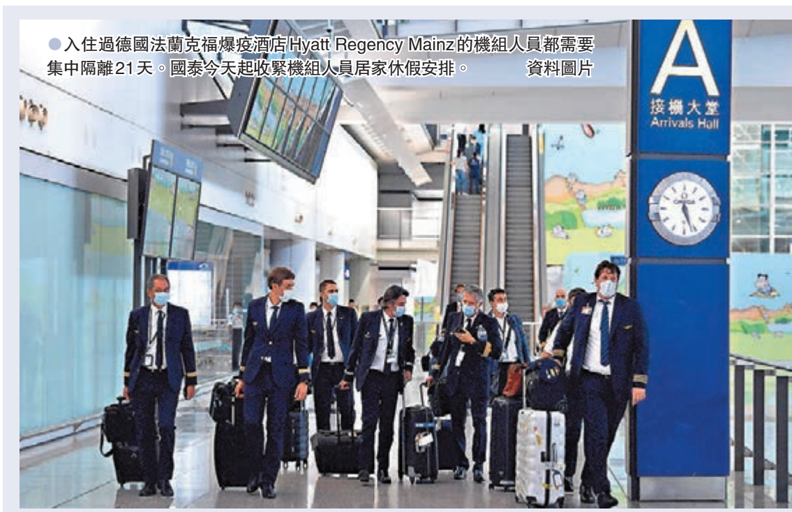
●入住過德國法蘭克福爆發疫酒店Hyatt Regency Mainz的機組人員都需要集中隔離21天。國泰今日起收緊機組人員居家休假安排。資料圖片