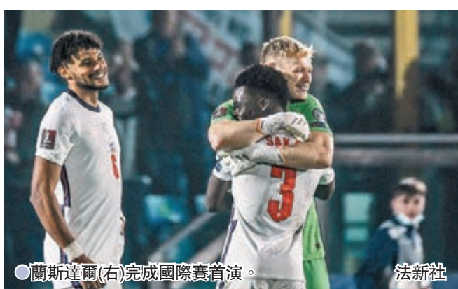
●蘭斯達爾(右)完成國際賽首演。