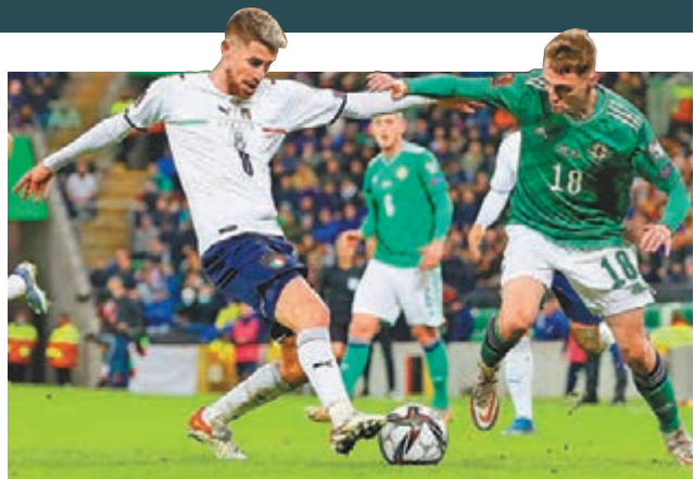
●佐真奴費路(左)整體表現雖然佳，但兩對瑞士射失的12碼卻非常致命。