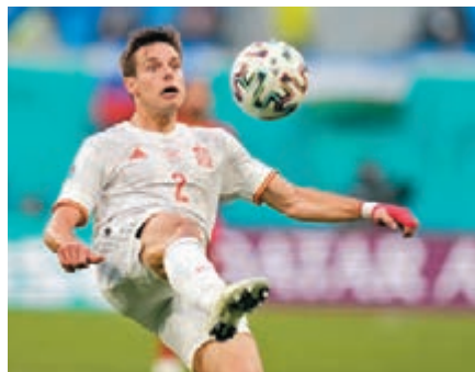
●艾斯派古達有望加盟巴塞。