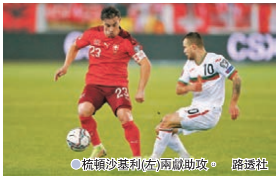
●梳頓沙基利(左)兩獻助攻。

今場是主將沙基利第100次代表瑞士上陣，成為球隊史上第五位達成100次上陣的球員。現效力法甲里昂的沙基利說：「在第100次代表瑞士於國際賽上陣的比賽取得世盃入場券，感覺像是夢想成真。這個成就屬於全隊上下的功勞，即使我們處於逆境仍然充滿信心。」