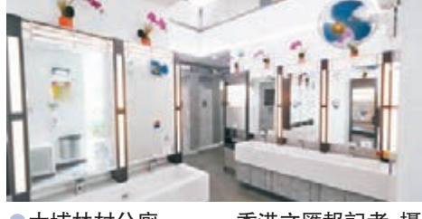
●大埔林村公廁