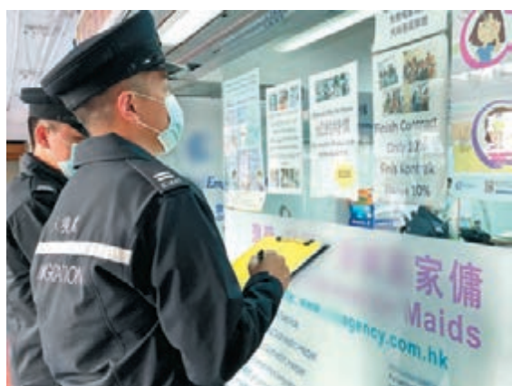
▲入境處職員於店外抄寫資料。