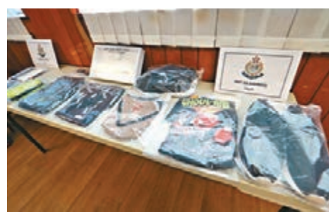
●警方檢獲手機店竊賊作案時所穿衣服。

網上早前流傳該名手機竊賊作案閉路電視視頻，視頻顯示15日下午2時許，旺角先達廣場一間手機舖店主向客人收購13部iPhone手機，其間短暫離開，到另一間手機舖取現金支付款項。這時，一名身穿灰色上衣、米色背心，背着灰色背包的肥胖身材男子進入，與顧客閒聊兩句後打開櫃檯門及走入店內，將貨架上的13部iPhone手機一手掃入背囊內，隨即施施然離去。顧客雖覺有