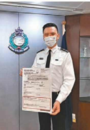
●謝誠毅指入境處絕不容忍外傭跳槽行為。

他補充，入境處人員有需要時亦會主動與外傭的前僱主聯絡，以了解外傭是否涉及及跳槽，並留意會否出現多名外傭以同一樣的原因「斷約」，評估會否出現不良中介教唆外傭跳槽的情況，並於有需要時與勞工處合作打擊有關行為。