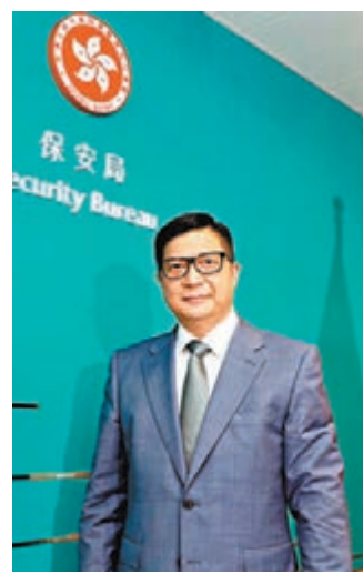
●鄧炳強指應檢視香港所面對的國安挑戰，再立二十三條更有效。

鄧炳強在專訪中強調要警惕潛在的社會風險。他指，過往兩年，亂港分子對年輕人的洗腦仍有殘留陰影，社會上想危害國家安全的人不停做出對政府或執法部門的不實指控，目的是影響政府、執法部門的公信力，企圖有朝一日再做危害國家安全的事情。「我們不會讓這些人得逞，我們會更專業，也會向市民做好解說工作，讓市民看到真相。」