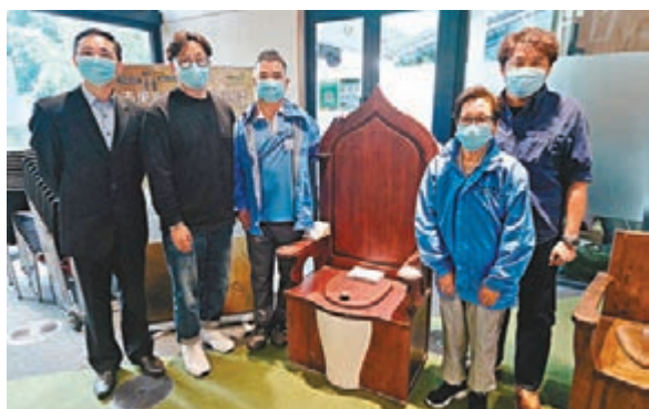
●香港廁所協會公布香港最佳公廁選舉2021結果。

香港文匯報訊（記者文森）公廁環境反映城市及居民的綜合素質，適逢明天是「世界廁所日」，香港廁所協會昨日發表全港公廁的整體營運情況報告，評選出優良及急待改善的廁所（見表），港澳碼頭公廁在去年「最差廁所」中榜上有名，但今年進步明顯，成為「最佳公共運輸廁所獎」，但造價半億元的觀塘海濱公園，其公廁卻臭絕全港。協會指出，香港不少公廁採用舊式設計，即座廁旁有抽風系統，若如廁後未蓋廁板沖廁，細菌及病毒可經抽風系統擴散，估計全港65%公廁有此播疫危機，建議食環署在公廁內加裝空氣清新機。