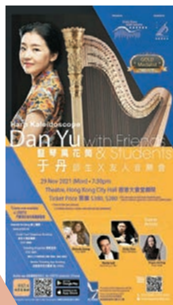
于丹聯同好友與高足舉行音樂會。