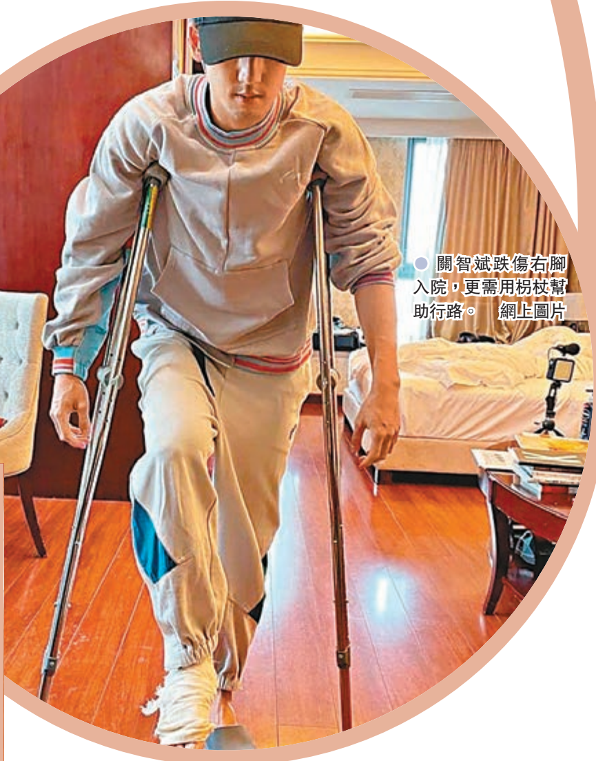
關智斌跌傷右腳入院,更需用拐杖幫助行路。