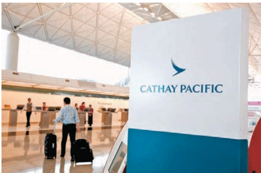
●國泰確認3外籍貨機機師曾嚴重違反機組人員在外站逗留規定。

另外，昨日港新增4宗輸入個案，全部涉及L452R變異病毒株，其中兩人由A組高風險地區抵港，分別是英國和巴基斯坦，抵港時在機場「檢測待行」的結果呈陽性，另兩人曾到訪中風險地區，包括新加坡、德國和葡萄牙，其後在檢疫期間確診。