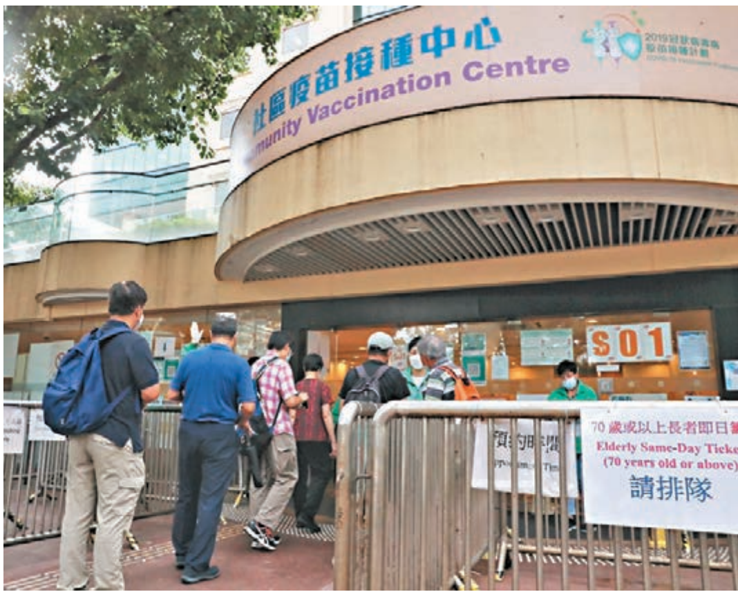
●近40萬名完成接種兩劑科興疫苗逾半年的市民，下周二（23日）起合資格打第三劑新冠疫苗。

另外，有消息指衛生署衛生防護中心轄下聯合科學委員會今日開會，會跟進新冠疫苗顧問專家委員會日前建議批准將科興疫苗的適用年齡降至3歲兒童的決定，釐定接種優先組別後將建議交予食衛局正式批准。