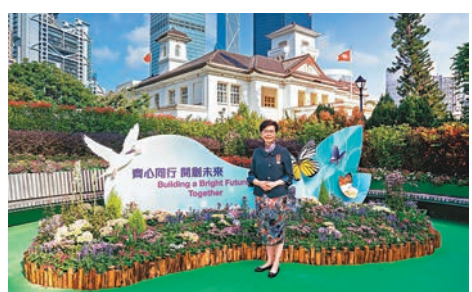
●特首在禮賓府「打卡」。是本地可見的品種，寓意正如《北部都會區發展策略》中倡議的其中一項原則——發展與保育並重。

禮賓府由昨日開始一連3天舉行年度的授勳典禮，行政長官林鄭月娥昨日在fb發帖表示，留意到獲授勳的賓客和他們的家人都喜歡到禮賓府的不同角落拍照留念，所以她自去年開始就請新聞處及康文署的同事安排一些「打卡」位。去年，隨着香港國安法頒布實施和新冠疫情，部門同事就設計了「國安」、「家安」、「民安」、「以愛走出疫境」的花圃，今年則是「齊心同行、開創未來」，響應2021年施政報告主題，而花圃上的雀鳥和蝴蝶都是本地可見的品種，寓意正如《北部都會區發展策略》中倡議的其中一項原則——發展與保育並重。