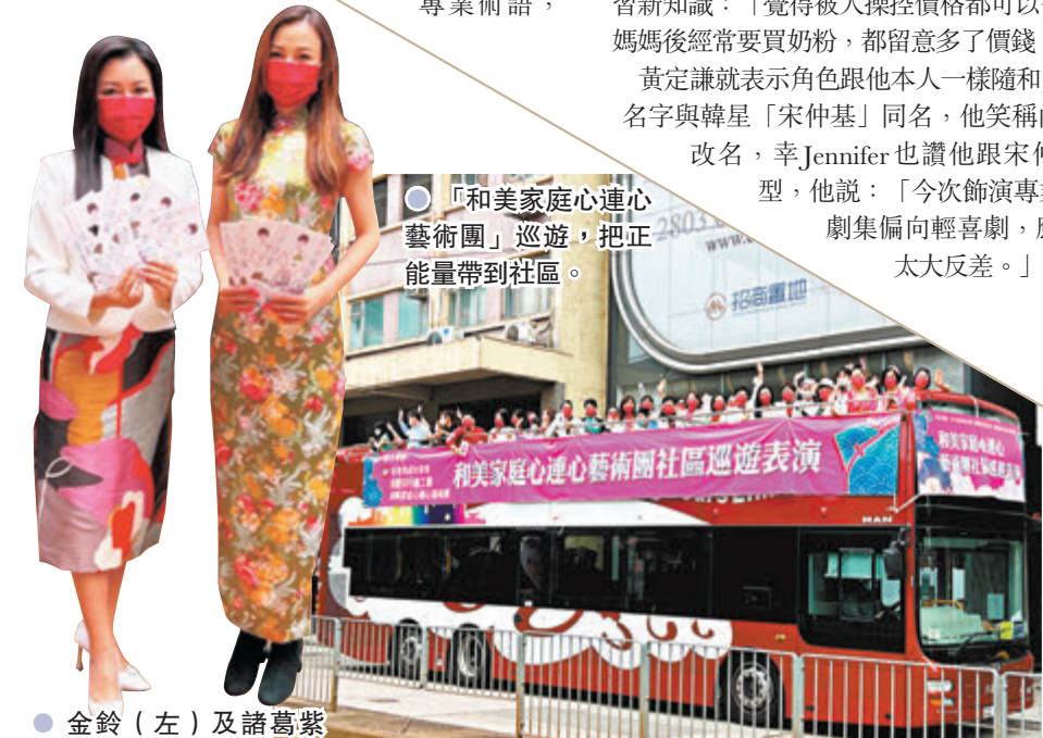
「和美家庭心連心藝術團」巡遊，把正能量帶到社區。